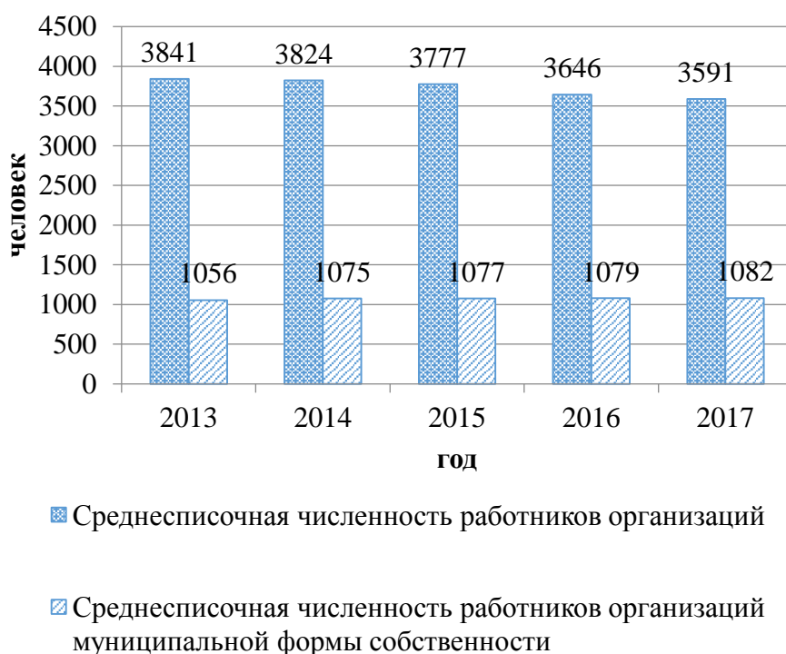
Рисунок 2 - Среднесписочная численность работников организаций за январь-декабрь в 2013-2017 гг., человек

За период 2013-2017 гг. наблюдается ежегодное сокращение среднесписочной численности работников организаций (Рис. 2). В 2017 г. показатель составил 98,5% к значению предыдущего года и 93,5% к значению к 2013 г.