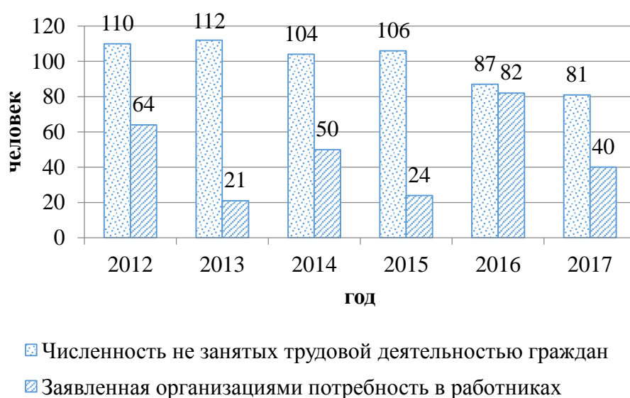
Рисунок 3 - Численность не занятых трудовой деятельностью граждан на конец года и заявленная организациями потребность в работниках, человек

Анализ ситуации на рынке труда показывает, что уровень скрытой безработицы на территории Кореневского района по прежнему высок. При этом численность официально зарегистрированных безработных была практически в четыре раза ниже, чем данные, полученные по материалам выборочных обследований населения по проблемам занятости: в 2012 году она составила около 31 %.