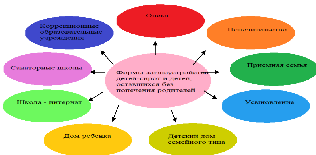
Рисунок 1 – Формы жизнеустройства детей, оставшихся без попечения родителей

школа - интернат, санаторные школы, коррекционные образовательные учреждения) [5, с. 5], данные представлены на рисунке 1: