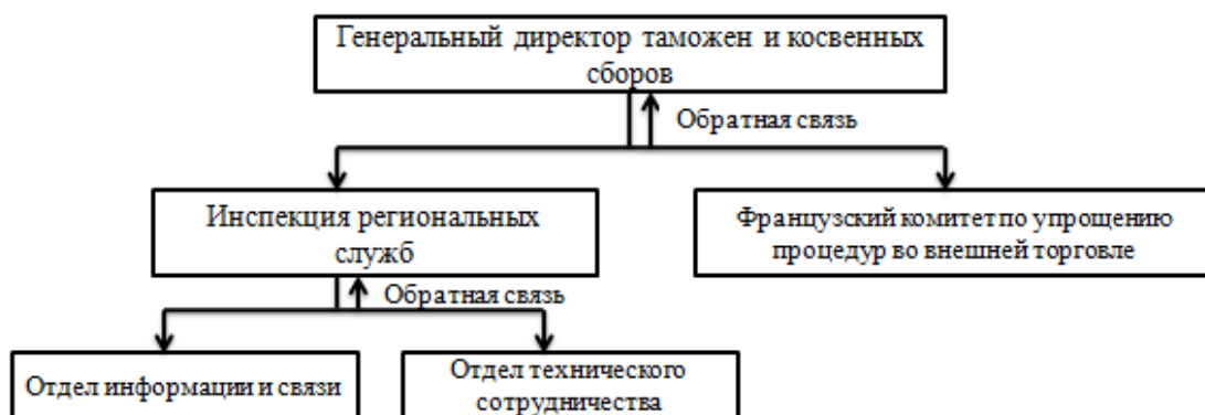
Рис.1. Структура центрального аппарата таможни Франции

Таможенные службы, находящиеся вне центрального аппарата таможни, подразделяются на две категории: внешние органы региональной компетенции, внешние органы национальной компетенции [3].