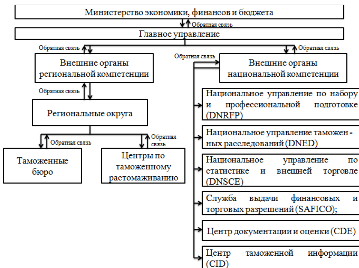
Рис.2. Структура таможенных органов Франции

Из представленной выше схемы системы таможенных органов таможенной службы Франции, можно заметить, что она обладает рядом отличий. Данные отличия заключаются в построении самой структуры взаимодействия элементов и количеством их в системе. Так, например, внешние органы региональной компетенции и внешние органы национальной компетенции обладают разными задачами для достижения цели своей деятельности, не взаимосвязаны между собой и не имеют обратных связей. Однако нельзя не сказать об иерархичности, которая присуща как таможенной службе России, так и таможенной службе Франции. Таможенная система России имеет менее разветвленную структуру и строго иерархичное и взаимосвязанное управление (рис.3) [7].