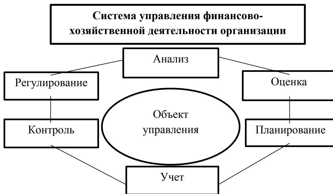
Рисунок 1 - Роль финансового анализа в системе управления

активов и пассивов с помощью системы аналитических показателей, методических разработок и статистических данных о деятельности организаций. [1, с. 11]