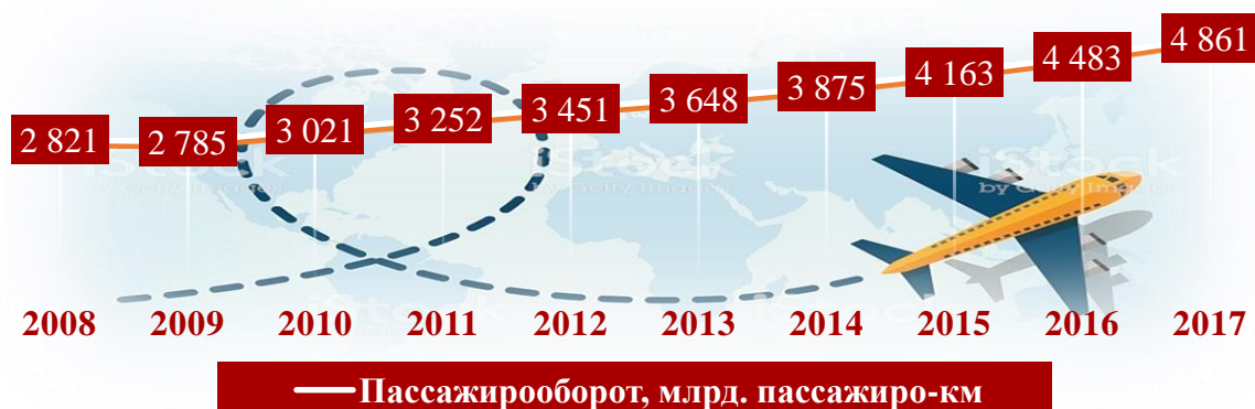
Рисунок 4. Динамика мирового пассажирооборота воздушного транспорта за 2008 – 2017 гг. (международные регулярные коммерческие перевозки)

сообщений, сделанных за данный год воздушным транспортом (т.к. темп прироста числа перевезённых за 2009 год пассажиров положителен).