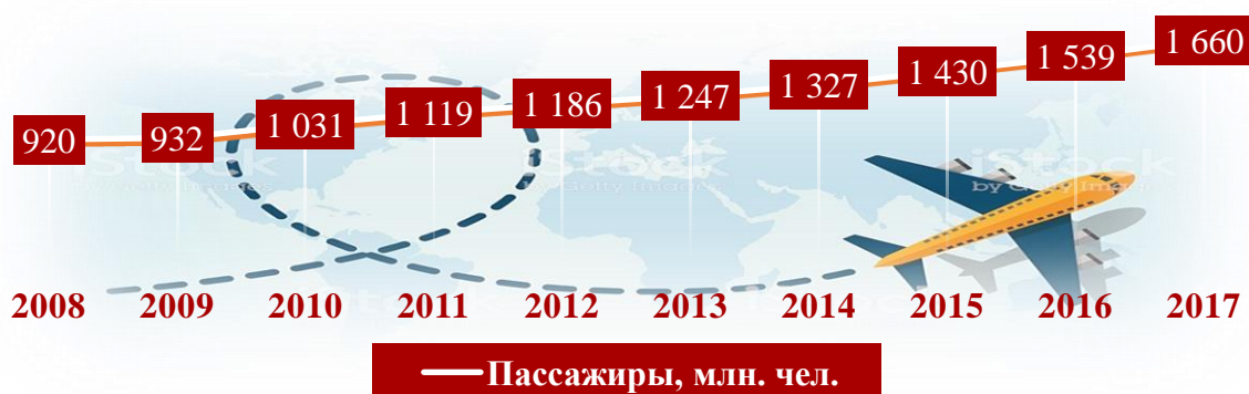
Рисунок 3. Динамика объёма международных коммерческих воздушных перевозок в мире за 2008 – 2017 гг. (регулярные перевозки)

Как показывает анализ, результаты которого представлены в таблице 2, объём международных воздушных перевозок в период с 2008 по 2017 год имеет непрерывный рост. Значение общего объёма перевезённых за год пассажиров увеличилось на 720 единиц и за 2017 год составило 1 660 пассажиров, при этом годовой прирост за аналогичный год составил 7,9 %.