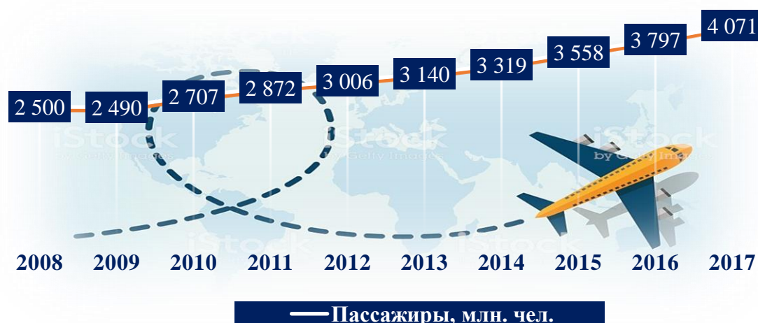
Рисунок 1. Динамика объёма коммерческих воздушных перевозок в мире за 2008 – 2017 гг.(регулярные перевозки)

человек: в 2008 году данный показатель составил 2 500 млн. человек, а в 2017 году число перевезённых пассажиров увеличилось в 1,6 раза и достигло отметки в 4 071 млн. человек.