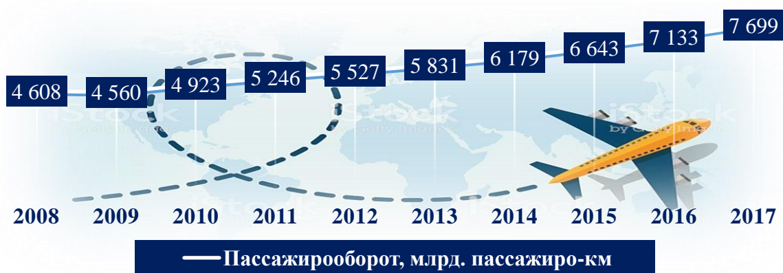
Рисунок 2. Динамика мирового пассажирооборота воздушного транспорта за 2008 – 2017 гг. (регулярные коммерческие перевозки) 1

В 2017 году годовой пассажирооборот достиг значения в 7 699 420 млн. пассажиро-км, при этом годовой прирост данного показателя за 2017 год составил 7,9 %. Увеличение данного показателя говорит о росте эффективности работы воздушного транспорта.