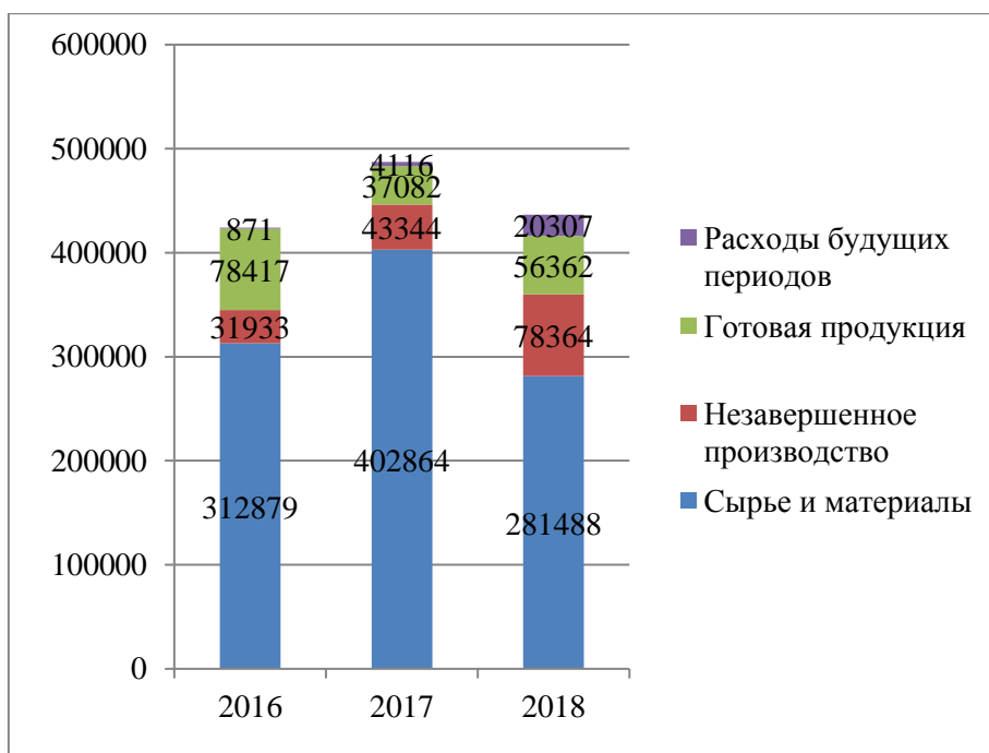
Рисунок 2 – Структура запасов СХПК ИМ. ГАГАРИНА

Структура запасов СХПК ИМ. ГАГАРИНА представлена на рисунке 2.