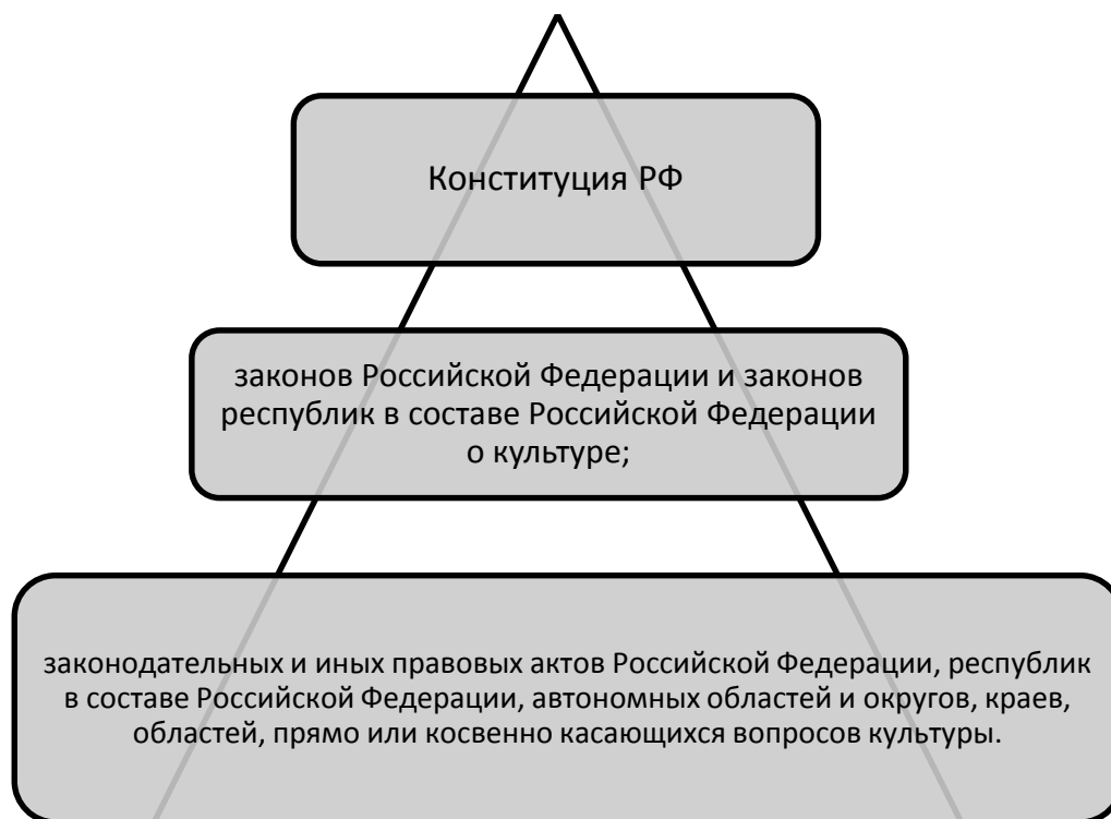
Рисунок 1. Система НПА основ законодательства по культуре РФ

Законодательство Российской Федерации о культуре состоит нескольких НПА, система которых представлена на рисунке 1.