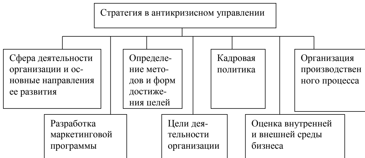
Рисунок 1. Элементы стратегии в антикризисном управлении [3, с. 45]

Состав стратегии в антикризисном управлении, как правило, включает в себя элементы, отраженные на рисунке 1.