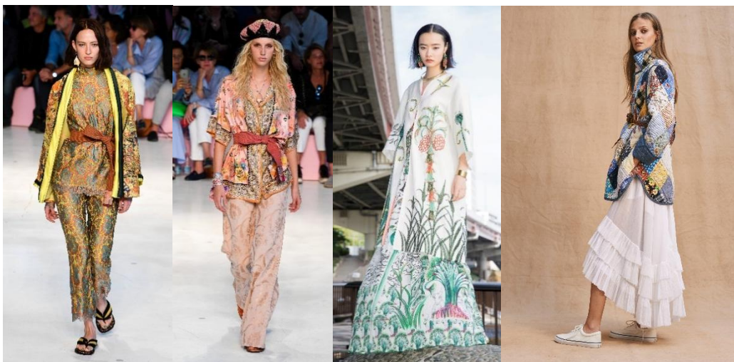
Рисунок 1.4 – Этномотивы в коллекциях Etro, Tsumori Chisato, Ralph Lauren [8].

В современном мире наличие смысла определяет ценность объекта. Мода XXI века не лишена смысла. Она общается с помощью символов, открывающихся тому, кто их ищет.