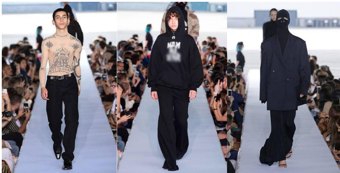
Рисунок 1.3 – Тюремная символика в коллекции весна-лето 2019 Vetements [8].

Современная одежда в корне отличается от традиционной. Орнаменты, нанесенные на ткань, лишены функции оберега, но по одежде все так же можно распознать носителя. Тренды дизайна направлены на сохранение памяти предков и перевоплощение опыта поколений в современную форму. Об этом писали в своей статье Иванов Д.Н., Кулешова А.А.: «Особенно явно на рубеже XX – XXI веков наблюдается множество новых технологий в модной индустрии, навеянных смелыми идеями авангардных течений. Их логическое продолжение отражается в современных экспериментах с формой, манипуляциях с текстилем, поисках конструкций и структур с новыми свойствами» [9, С. 577].