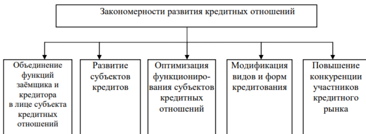
Рис. 3. Закономерности развития кредитных отношений [3, с.49]

В современных кредитных отношениях организации кредитора и заёмщика могут выполнять одни и те же субъекты. Физические лица могут выступать как в качестве заёмщика (получая денежные средства в коммерческих банках), так и кредитора (предоставляя свободные денежные средства в пользование иным субъектам). Юридические лица, получая кредиты от коммерческих банков, могут в товарной форме кредитовать своих потребителей.