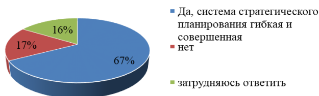
Рисунок 2. Оценка респондентами, существующей системы стратегического планирования

В процессе исследования респондентам предлагалось, оценить совершенна и управляема система стратегического планирования в организации, как выяснилось 67% респондентов считают, что в организации, система стратегического планирования гибкая и совершенная, только 17% респондентов считают, что данная система не совершенна. Это говорит об эффективности существующей системы стратегического планирования в организации (рис. 2).