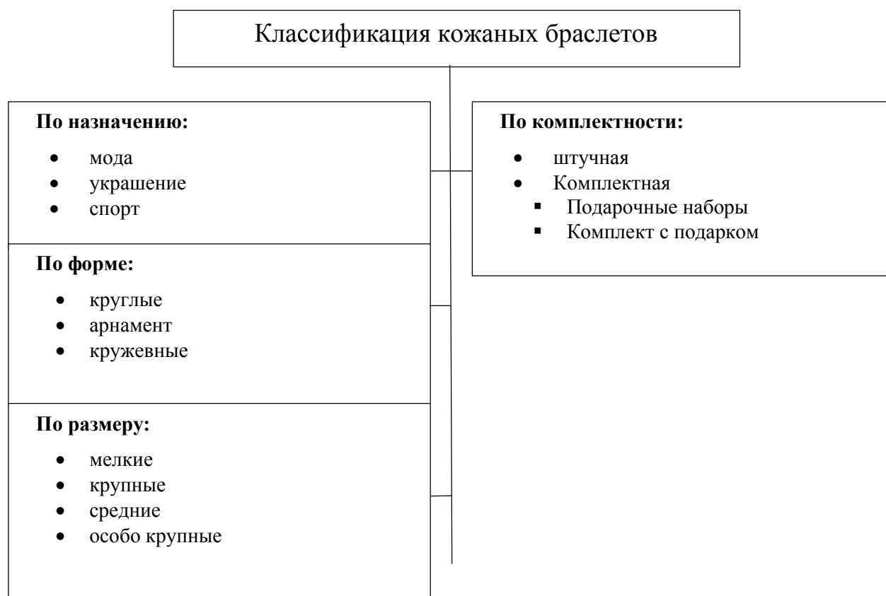
Рисунок 1.Классификация рассмотренных браслетов

Интерес к качественным вещам является достаточно высоким. Дешёвая импортная в настоящее время мешает развиваться отечественным производителям браслетов, и в скором времени ничего не измениться. Потому что люди любят приемлемое качество по доступной цене. Российские производители не являются конкурентоспособными с китайскими партнёрами.