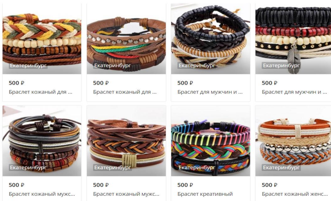
Рисунок 2. Предполагаемый ассортимент интернет-магазина

Так как сервис является частично бесплатным, это позволяет протестировать интерес и проанализировать спрос на данную продукцию. Также после анализа можно создать первичный портрет целевого клиента.