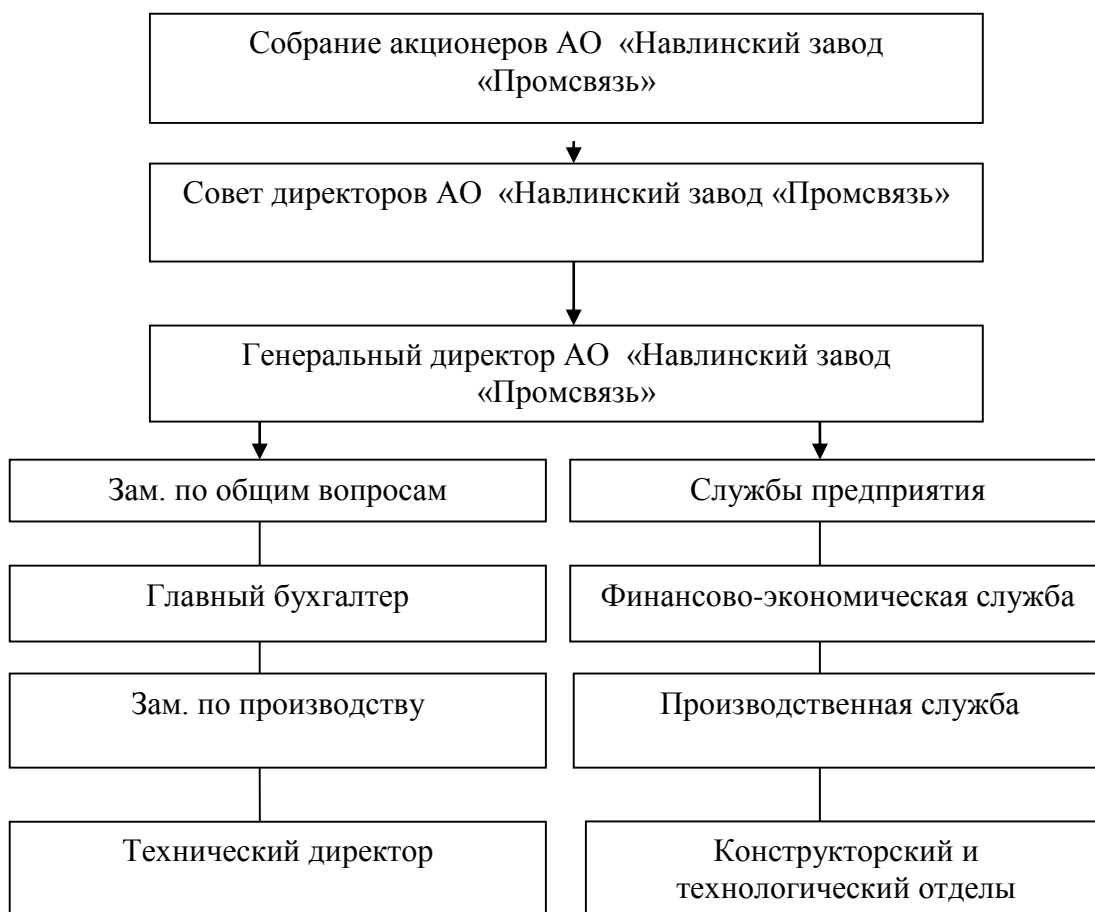
Рисунок 1 – Организационная структура управления АО Навлинский завод «Промсвязь»

Отделом технического контроля осуществляется контроль за качеством выпускаемой продукции, разрабатываются предложения, направленные на предупреждение и уменьшение брака, организуется контроль за исследованием качества поступающих на предприятие комплектующих и сырья.