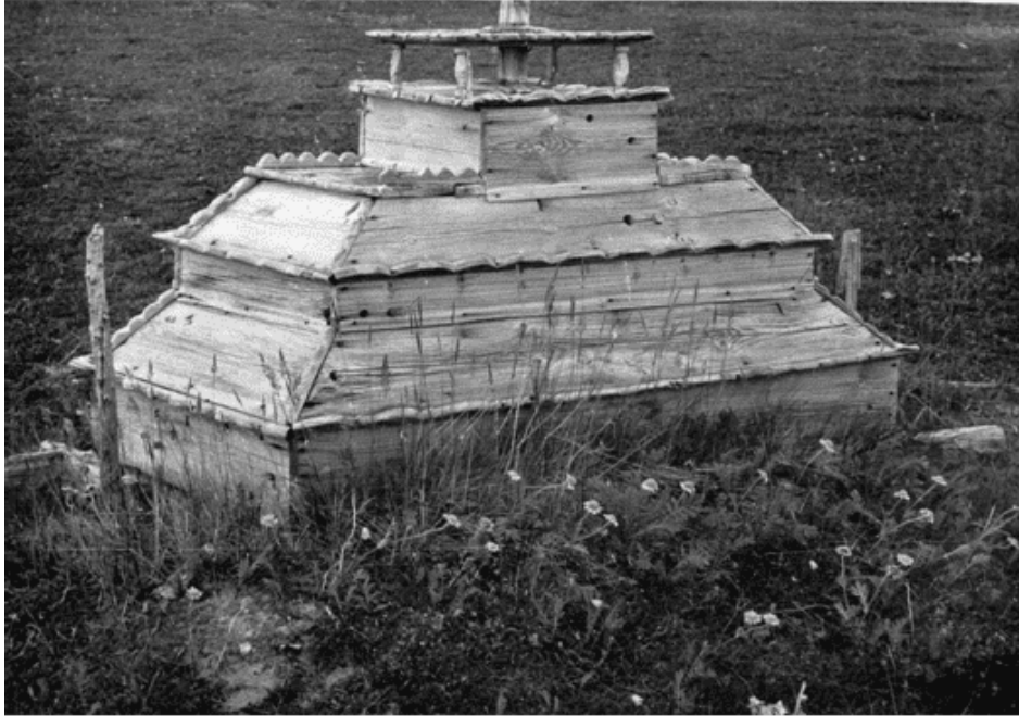
Рис. 2. Деревянные надгробные саркофаги.

Крыши таких надгробных сооружений венчают искусно вырезанные восьмиконечные кресты, - иногда с деревянной птицей наверху. Также как и возле других надгробных построек здесь имеется вкопанное возле захоронения дерево.