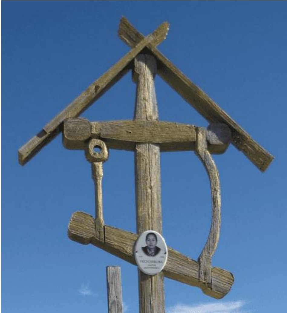
Рис. 6. Модели скребков на надгробном кресте женского захоронения.

Весьма характерно, что так же как у долган возле надгробного сооружения можно видеть вкопанное дерево, так и у эвенков, кочевавших в междуречье Оби и Енисея, встречались вкопанные в надгробный холм доска или шест.