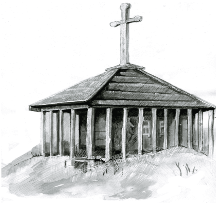
Рис.4. Надгробное сооружение в виде домика.

Постройки деревянных домиков на русских кладбищах известны длительного периода: с раннего средневековья по XIX в. Они представляли собой срубные домики с двускатной крышей и маленьким оконцем. Внутри домины в дни поминовений клали различные “приносы” мертвому. Эти памятники срубом, с домиком и крышей, которые назывались “голубец” “голбец”, к началу XX столетия в европейской части России были запрещены. Однако в некоторых местах, например, в глухой Вологодской губернии они сохранялись. У долган на Таймыре они существуют и в настоящее время (рис. 4).