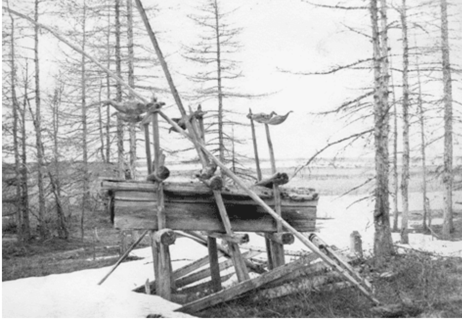
Рис. 5. Скульптурные изображения птиц на шаманском воздушном захоронении.

Священник Суслов сообщал в конце XIX в., что крещенные эвенки в годы его пребывания в Илимпии уже погребали умерших в земле, причем вырывали для покойника глубокую могилу. Опустив гроб, чтобы умершего “не давила земля”, тунгусы устраивали над ним бревенчатый настил, а над могилой устанавливали сруб с крышей [3, с. 167]. Такие же конструктивные особенности в погребениях встречаются в настоящее время и у восточных долган.