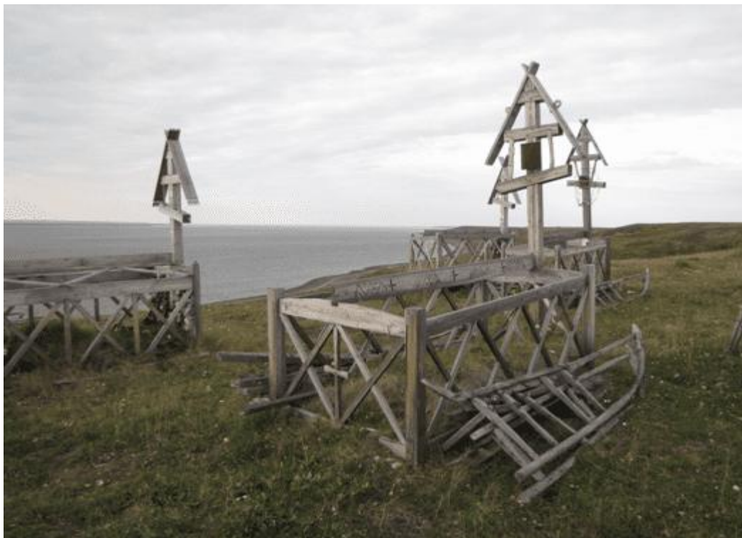
Рис. 1. Распиленные нарты возле намогильной ограды.

Передними концами полозья нарт направлены к ногам погребенного, так что соблюдается строгая ориентация захоронения: “запад - восток” (голова – ноги).