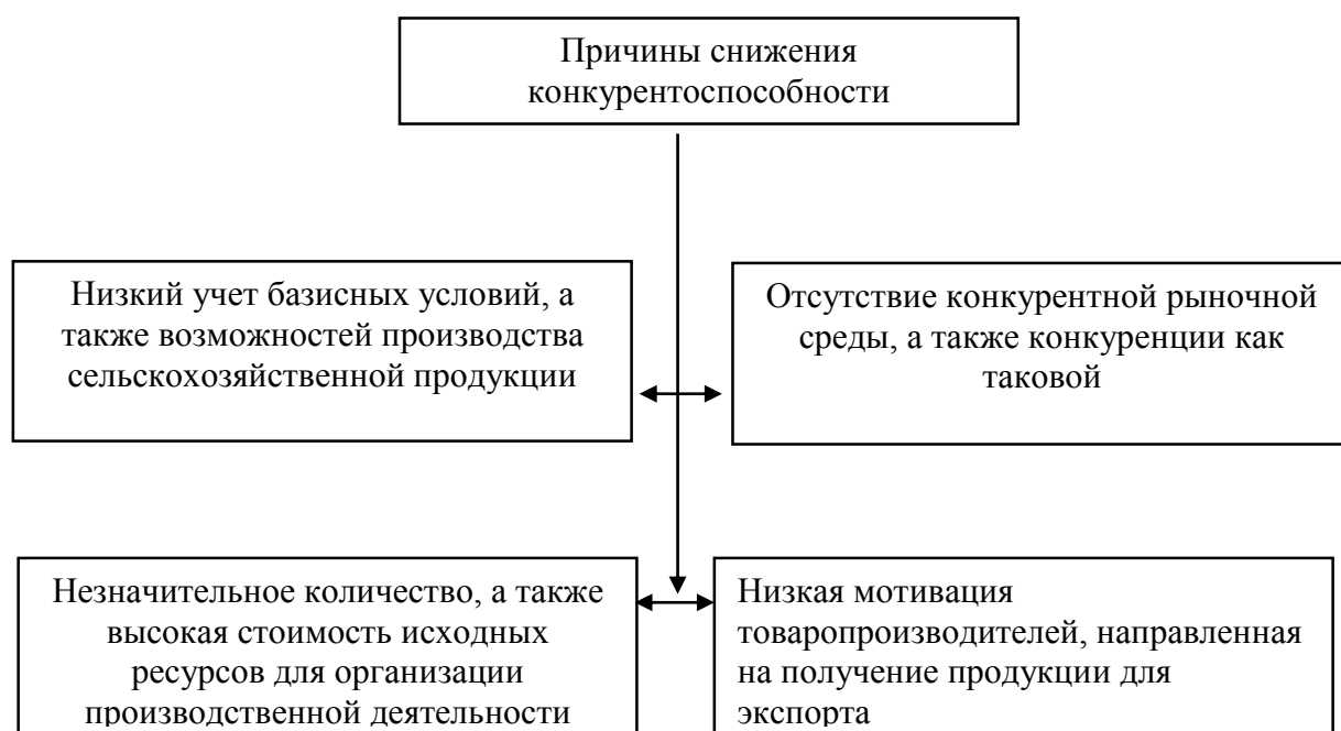
Рисунок 1 – Причины снижения конкурентоспособности сельскохозяйственных предприятий

К важнейшим причинам, которые значительно снижают конкурентоспособность сельскохозяйственной отрасли, следует отнести следующие (рисунок 1).