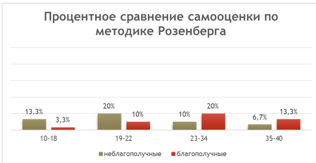
Рисунок 1 «Процентное сравнение самооценки по методике Розенберга»

По результатам методики Розенберга, отображенных на рисунке 1, можно сделать вывод о том, что шкалы заниженное самоуважение (10-18 баллов) и низкое самоуважение (19-22) у подростков из неблагополучных семей показывают высокий уровень, что свидетельствует о том, что подростки из неблагополучных семей более склонны видеть только свои недостатки и акцентируют внимание только на своих слабых сторонах. Когда как у подростков из благополучных семей процентное соотношение меньше на 4 раза, что указывает на высокую эмоциональную оценку собственной значимости.