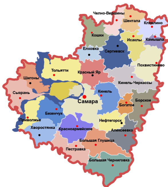
Рисунок 1. – Карта Самарской области

Объектом в данной работе выступает территориальное планирование Самарской области. Самарская область входит в Приволжский Федеральный округ. На западе граничит с Ульяновской и Саратовской областью, на севере с Татарстаном, на юге с Казахстаном, а на юго-востоке с Оренбургской областью. Самарская область была образована 14 мая 1928 года в качестве Средневолжской области. В 1929 году она была переименована в Средневолжский край, в 1935 году ее переименовали в Куйбышевский край. На протяжении временного периода с 5 декабря 1936 года по 25 января 1991 года носила название Куйбышевской области.