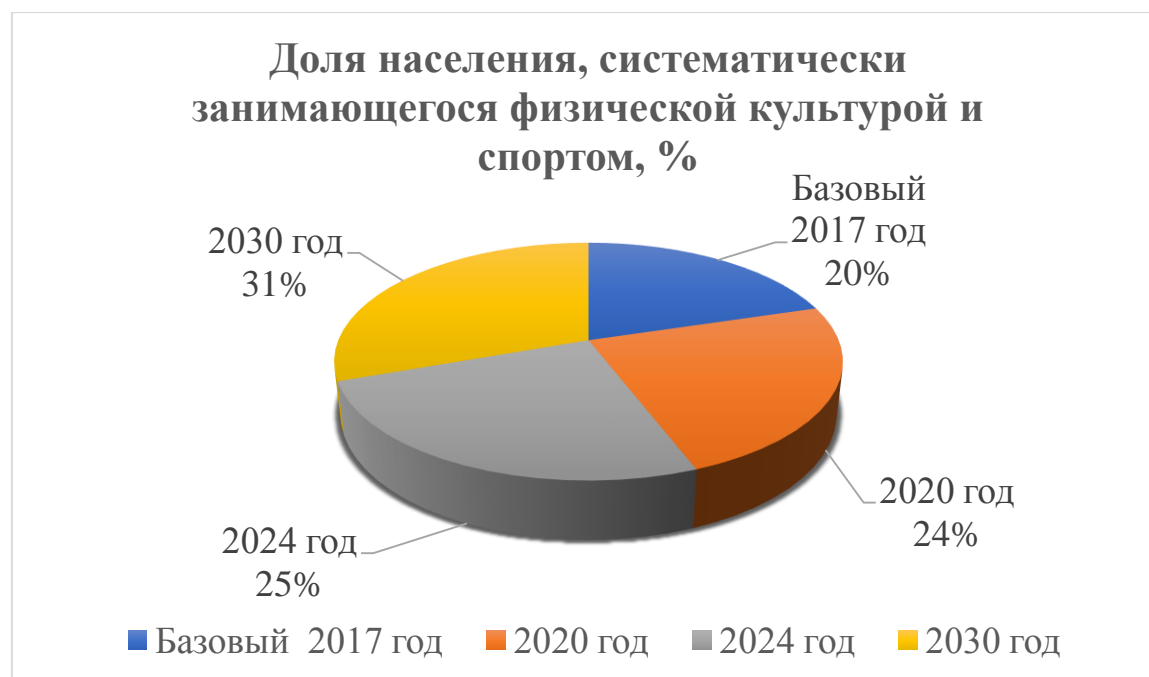
Рисунок 1. Доля населения, систематически занимающегося физической культурой и спортом, %.

Стратегическая цель «Высокое качество жизнеобеспечения граждан» - развитие физической культуры и спорта Рис. 1.