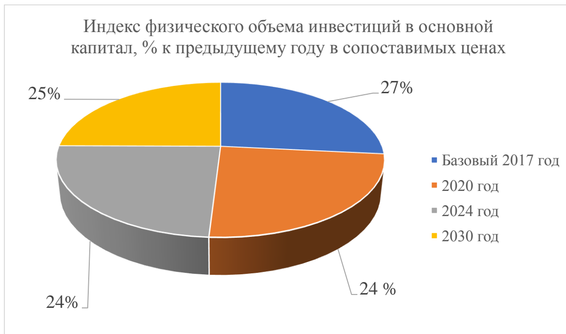
Рисунок 4 Индекс физического объема инвестиций в основной капитал, % к предыдущему году в сопоставимых ценах

трудоустройства, социального обслуживания (здравоохранения, социальной помощи), а также трудоустройства. Эти проекты способствуют снятию напряженности, связанной с интеграцией посетителей в существующее общество поселений. Реализация этих проектов даст положительные результаты, и работа в этих направлениях будет продолжаться Рис. 4.