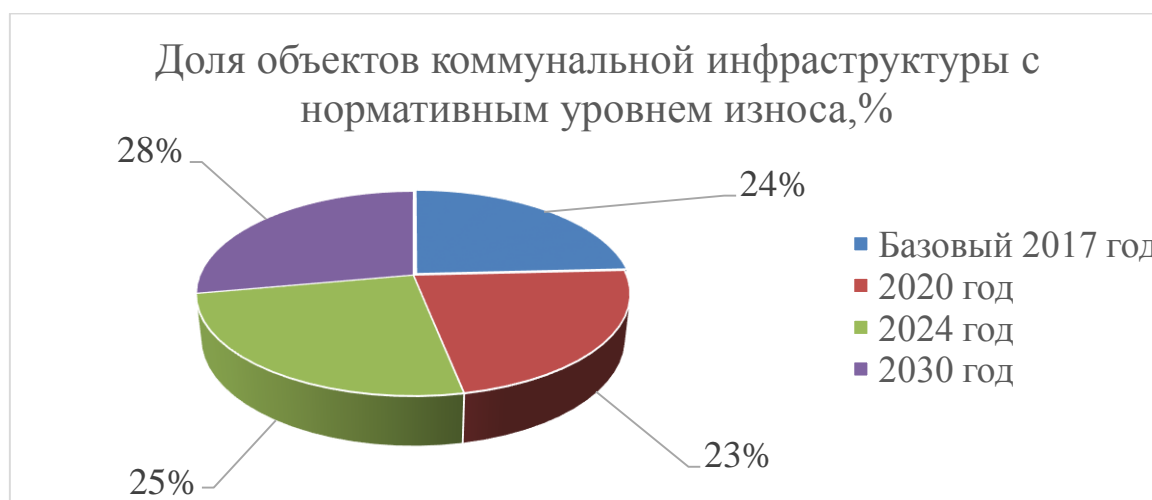
Рисунок 2 Доля объектов коммунальной инфраструктуры с нормативным уровнем износа, %

Стратегическая цель «Высокое качество жизнеобеспечения граждан» - высокое качество жилищно-коммунальных услуг Рис. 2.