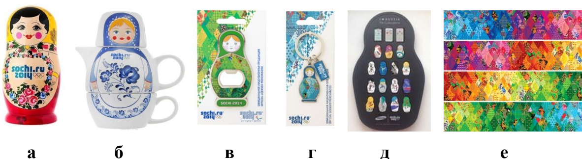
Рисунок 1. Сувениры олимпийских игр 2014: а - семеновская матрешка с хохломской росписью; б - чайный сервиз «Матрешка»; в - открывашка «Матрешка»; г - брелок «Матрешка»; д - набор значков «матрешка»; е - лоскутное одеяло с орнаментами разных национальных промыслов.

Помимо образа «матрешка» частичкой олимпийской символики стало и традиционное лоскутное одеяло, выполняемое в технике «пэчворк». Колоритное одеяло, собранное из 16 лоскутов, – орнаментов разных национальных промыслов России – стало своего главной визуальной концепцией Игр 2014 года (рисунок 3). Присутствие изделий русского народного промысла в олимпийской символике неслучайно. Россия, представленная гостям современными технологиями и архитектурными олимпийскими объектами, не теряет связь со своей культурой, богатейшей многовековой историей и красивыми традициями [3].