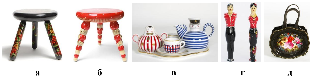
Рисунок 2. Сувениры финских дизайнеров Йохан Олин и Ааму Сонг: а, б - табуреты с резными, разрисованными под хохлому ножками; в - разрисованные чайные сервизы; г - матрешки непривычных форм; д - сумка мешок с изображением традиционного подноса в стиле Жостово.

В отличие от финских дизайнеров наша соотечественница из Ижевска Саша Виноградова продемонстрировала достаточно нестандартный взгляд на народные промыслы, расписав черепа в гжельском, хохломском, жостовском, городецком стиле народной живописи (рисунок 3).