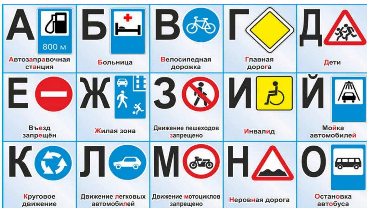
Рисунок 3. Дорожные знаки для водителей

П.: Ну а теперь, мы все попробуем себя в роли водителей. Я буду показывать знак, а вы, ориентируясь на его значение, попробуете проехать на самокате до ориентира, вернуться обратно, объезжая ориентир, передав эстафету следующему участнику (вариант усложнения: «змейкой» вокруг кеглей и обратно по прямой).