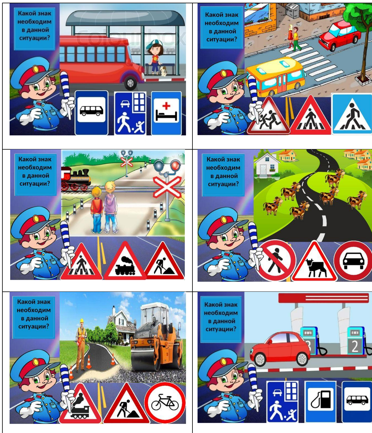
Рисунок 2. Игра поставь нужный знак