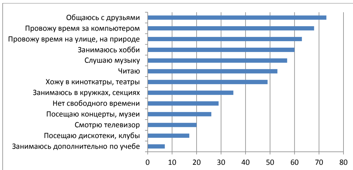
Рисунок 1. «Чем занимается молодежь в свободное время?»

Самым непопулярным занятием в свободное время стало получение дополнительного образования – всего 9%. Всего 9% молодежи проводят свой досуг образовываясь. Исходя из данных, полученных с помощью первого блока вопросов, мы можем сделать вывод, что у молодежи в таком возрасте существует сильная потребность в коммуникации, поэтому необходимо больше площадок, где молодые люди могли бы общаться друг с другом. Однако не стоит забывать про «мозги», новые умения и навыки, которые потребуются молодежи как в настоящем, так и в будущем, поэтому необходимо внедрять интеллектуальные, познавательные аспекты в досуг молодежи с помощью различных интерактивных, игровых форм.