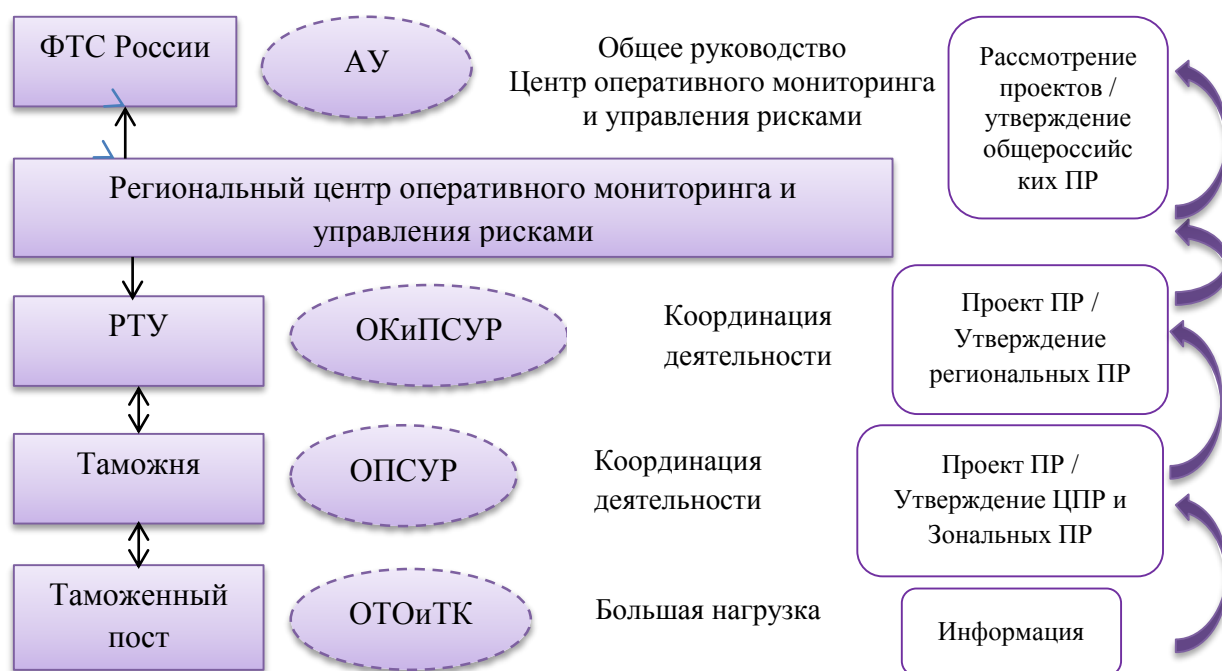
Рис. 3. Схема взаимодействия таможенных органов в СУ [13]

Сбор информации о проведении таможенных операций обеспечивают таможенные посты, где должностные лица таможенного органа формируют сообщения о рисковых ситуациях. Данные сообщения поступают в ОПСУР таможни, в регионе деятельности которой расположен таможенный пост. Должностные лица данного отдела рассматривают эти сообщения и на их основе формируют ЦПР или ЗПР, так как ОПСУР таможни является важным координирующим подразделением СУР. Далее дело переходит в РТУ, которым присущ повышенный уровень сложности аналитической деятельности.