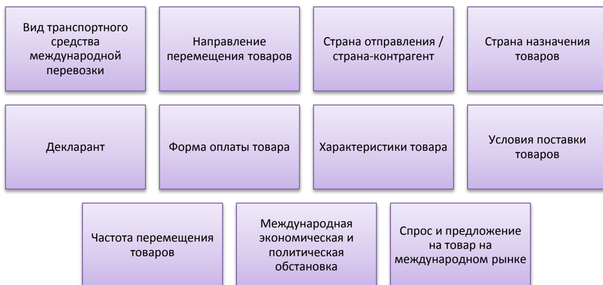
Рис. 1. Основные факторы, оказывающие влияние на уровень риска в таможенной деятельности

При обнаружении рискованной ситуации, сопровождающейся значительной вероятностью несоблюдения таможенного законодательства ЕАЭС, необходимо применение соответствующей меры по минимизации рисков.