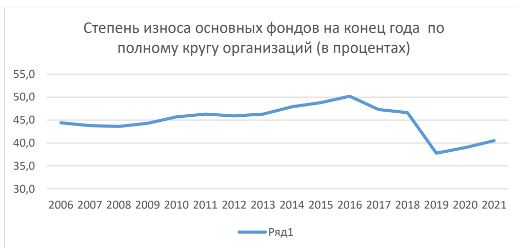
Рисунок 2 – степень износа основных фондов за 2004 – 2021 гг.

Степень износа основных фондов представлена на рис. 1.2.