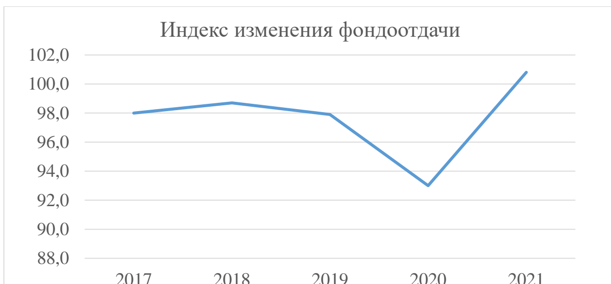
Рисунок 1.5 – индекс изменения фондоотдачи за 2017-2021 гг.

Чем выше значение показателя, тем более эффективно используются основные фонды. Анализируя динамику изменения можно сделать вывод, что эффективность использования основных фондов снижается с каждым годом до 2020 г. В 2021 году наблюдается значительное увеличение показателя.