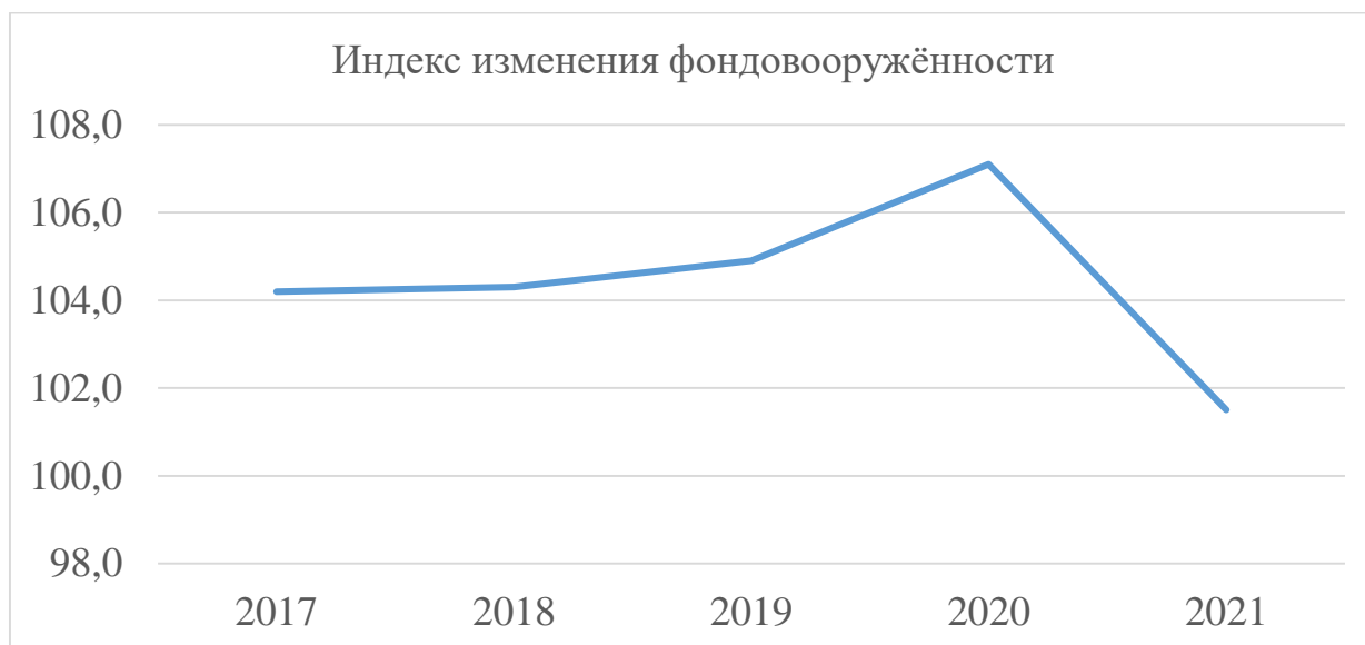
Рисунок 1.4 – индекс изменения фондовооруженности за 2017-2021 гг.

К основным параметрам определения эффективности использования основных фондов также относятся индекс фондовооруженности и фондоотдачи. Динамика их изменения представлена на рис. 1.4 и рис. 1.5 соответственно.