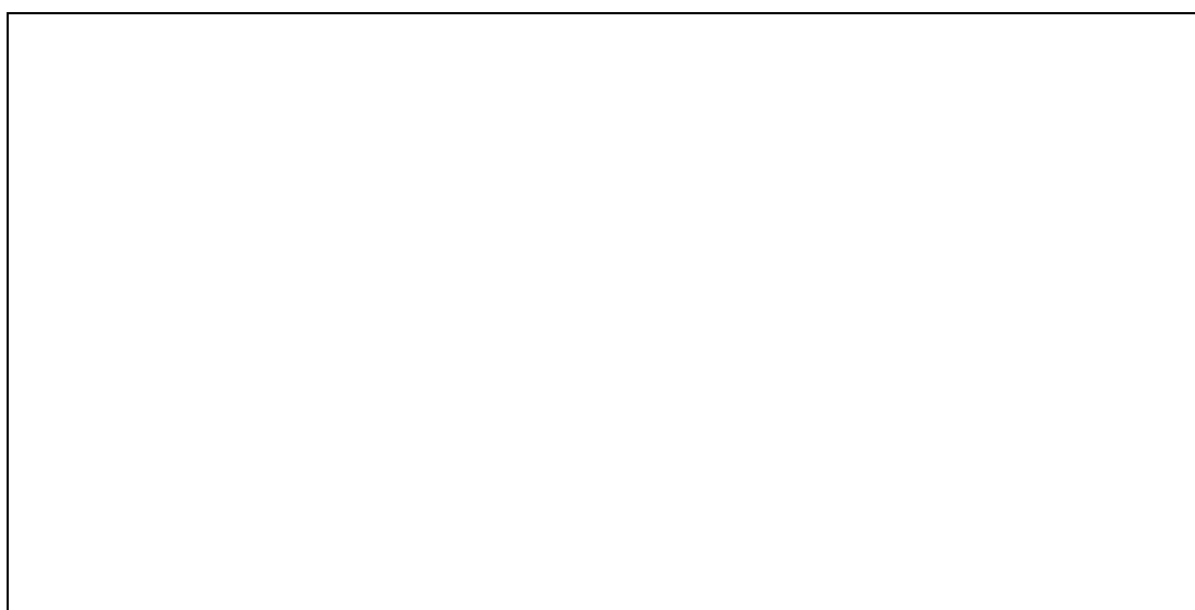
Рисунок 1. Индекс Mastercard Global Destination Cities Index 2019 года (млн.чел.)

Рассмотрим рисунок 1. Самым посещаемым международными туристами городом стал Бангкок (столица Тайланда). Еще одним городом, попавшим в десятку самых посещаемых городов, стал Сингапур, далее - Куала-Лумпур, за ним следуют ключевые города Восточной Азии - Токио, Сеул (11 место), Осака (12 место), Пхукет (14 место), Паттайя (15 место), Бали (19 место), Гонконг (20 место).[3]