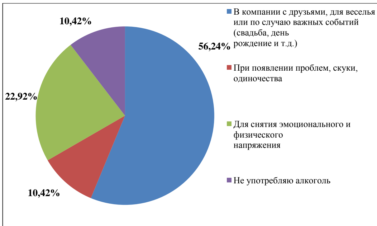
Рисунок 1. Результаты ответа на вопрос «Мотивы употребления спиртных напитков?».

В нашем исследовании мы также выяснили, что 68,75% (33 человек) уверены в том, что их друзья не считают их пристрастие к алкоголю чрезмерным. 10,42% (5 человек) ответили обратным образом, остальные спиртные напитки не употребляют. У 8,3% (4 человек) имеются проблемы в семье/вузе/на работе, связанные с алкогольной зависимостью. Выяснили, что 37,5% (18 человек) употребляют алкоголь максимум 2 раза в месяц, однако 10,42% (5 человек) опрошенных злоупотребляет крепкими напитками 1-2 раза в неделю. Среди интервьюированных 52,1% (25 человек) убеждены, что алкоголь вредит их здоровью, 27,1% (13 человек) считают его безвредным. Большая часть 56,25% (27 человек), по результатам анкетирования, никогда не задумывалась о способах борьбы с пристрастием к спиртным напиткам и не хотят бросать пить. Среди опрошенных 10,42% (5 человек) ищут пути решения проблемы алкогольной зависимости и хотят избавиться от пагубной привычки.