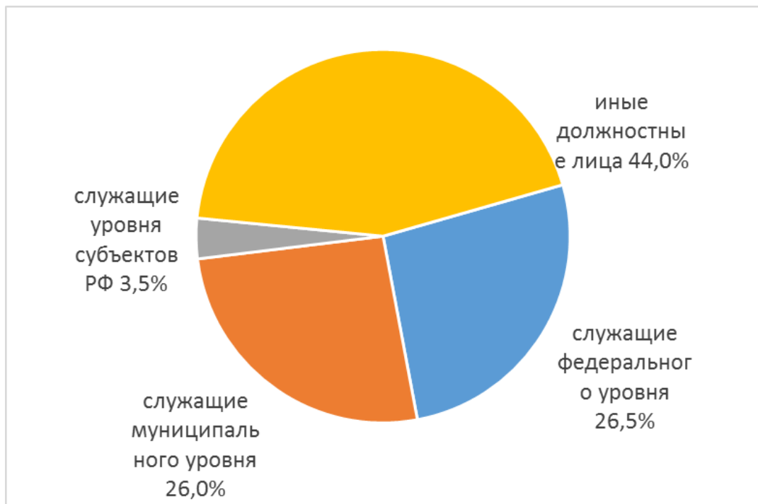
Рисунок 2. Структура государственных служащих, привлеченных к дисциплинарной ответственности [3]

Среди условий, способствующих возникновению конфликта интересов на гражданской службе, можно назвать [1, с. 219]: