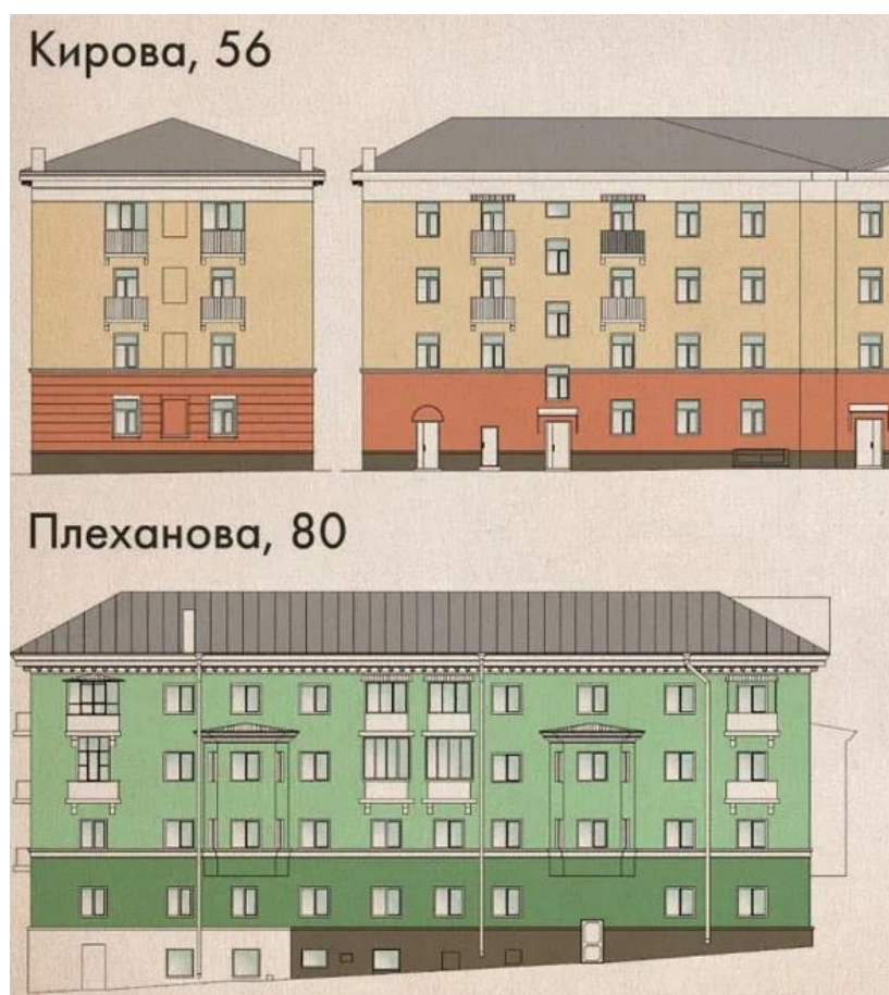
Рисунок 2. Примеры согласованных дизайнерских проектов по оформлению жилых зданий в Калуге

Калуга – это город с достаточно богатой историей и интересной архитектурой, которая, как и во многих других провинциальных городах, часто скрывается за многочисленными рекламными вывесками. Данная проблема была замечена представителями местной власти в прошлом году. 29 июня 2022 года Городская дума Калуги утвердила новые требования к благоустройству города. Основная задача – сохранить ценность и особенности архитектурных сооружений и, при этом, удовлетворить интересы коммерческих организаций, которые активно размещают свои помещения в обычных домах [2]. Для этого был внедрён новый дизайн зданий, в котором магазины, рестораны, кафе и прочая коммерция должны быть отделены от жилых помещений другим цветом. Примеры согласованных дизайнерских проектов представлены на рисунке.