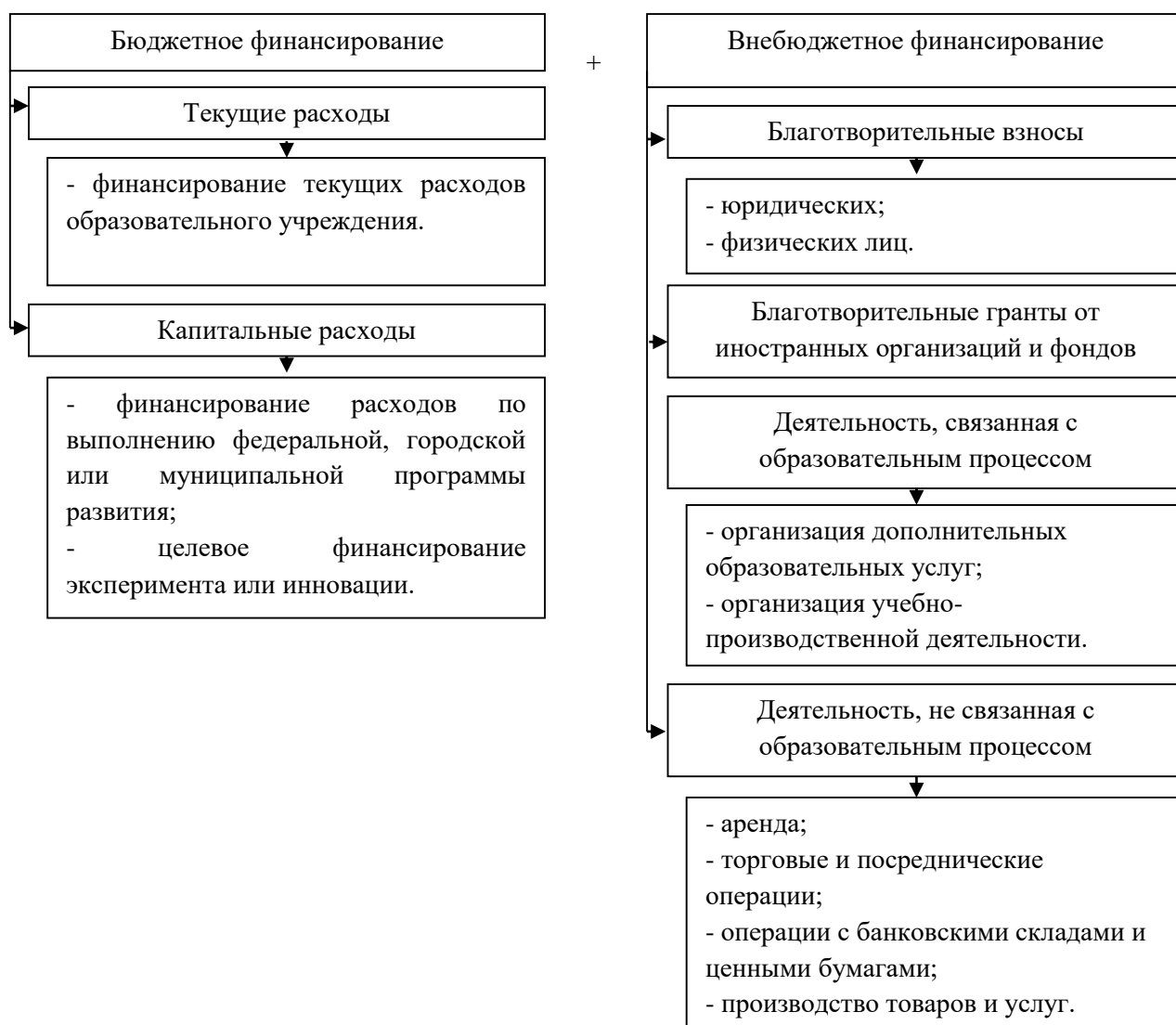
Рисунок 2. Структура многоканального финансирования образовательных учреждений. 2

Несмотря на сложные и кризисные явления в социально-экономическом положении в стране формируются и развиваются динамично организационно-правовые структуры образовательных учреждений, деятельность которых направлена на воспитание личности, подготовку и переподготовку специалистов соответствующего уровня, удовлетворения потребности каждого гражданина в углублении и расширении образования.