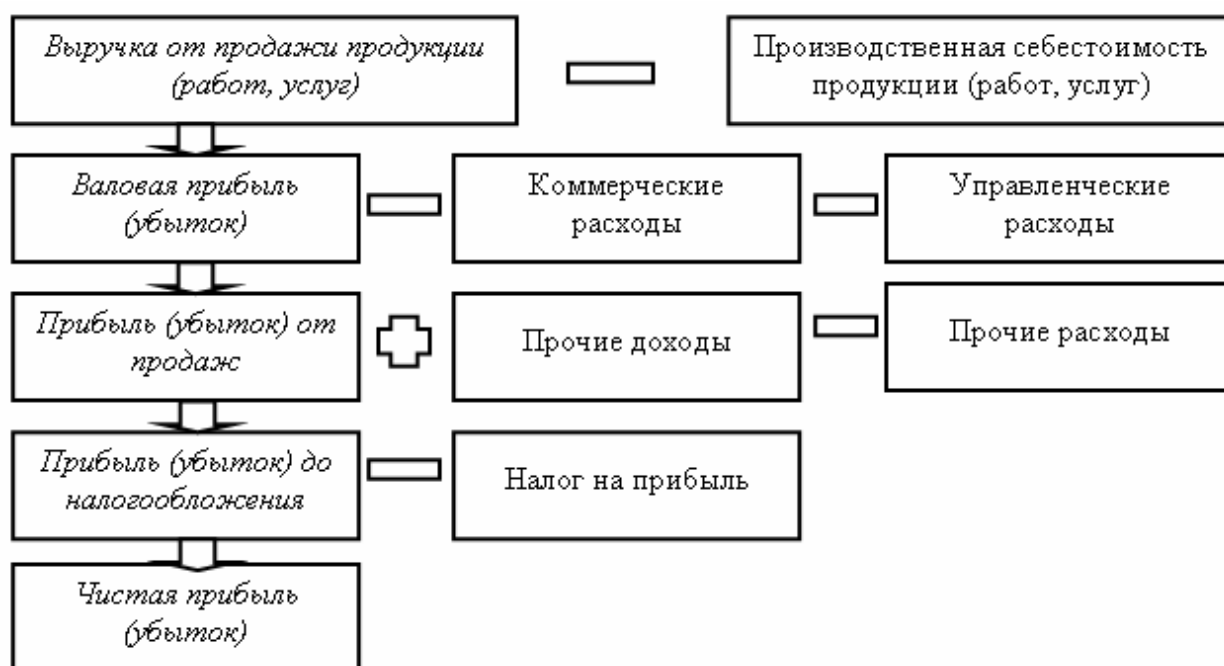
Рисунок 1 - Механизм формирования финансовых результатов предприятия

Традиционные методология и методика оценки эффективности производства ориентированы, в первую очередь, на валовые показатели, а проблема формирования финансовых результатов при этом остается второстепенной, а значит, в современных условиях требует решения. Поскольку прибыльность предприятий зависит не только от валовых показателей производства, то экономическое исследование финансовых результатов должно предоставить информацию о количественном и качественном влиянии на них не только экономико-организационных и технологических факторов, которые формируются непосредственно на предприятии, но и внешних: конъюнктуры, ценовой и налоговой политики, паритетности взаимоотношений с производителями сырья.