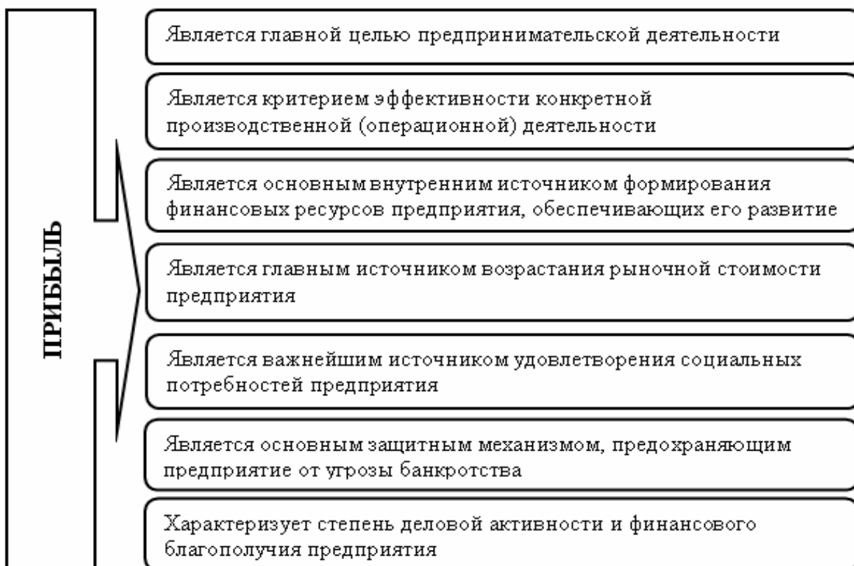
Рисунок 2 - Сущностные характеристики прибыли от производственно-хозяйственной деятельности предприятия

результатов отчетного периода, представлены на рисунке 4.