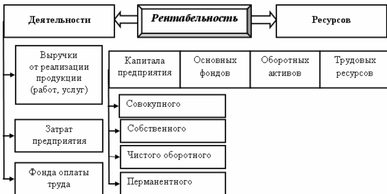
Рисунок 3 - Система показателей рентабельности предприятия