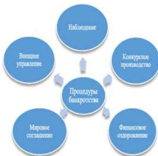
Рис. 3. Процедуры банкротства

Реальное банкротство характеризуется абсолютной неспособностью организации восстановить свою платежеспособность и экономическую устойчивость, из-за чего в дальнейшем оно объявляется юридически банкротом;