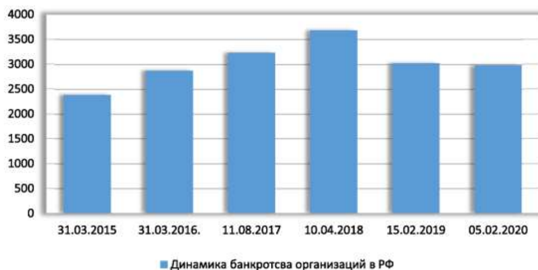
Рис. 4. Динамика банкротства организаций в Российской Федерации

На рис. 4 представлена динамика банкротства организаций в Российской Федерации.