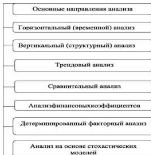
Рис. 1. Основные направления анализа

Экономический анализ осуществляется с помощью разного вида моделей, предполагающие использование определенной информации.