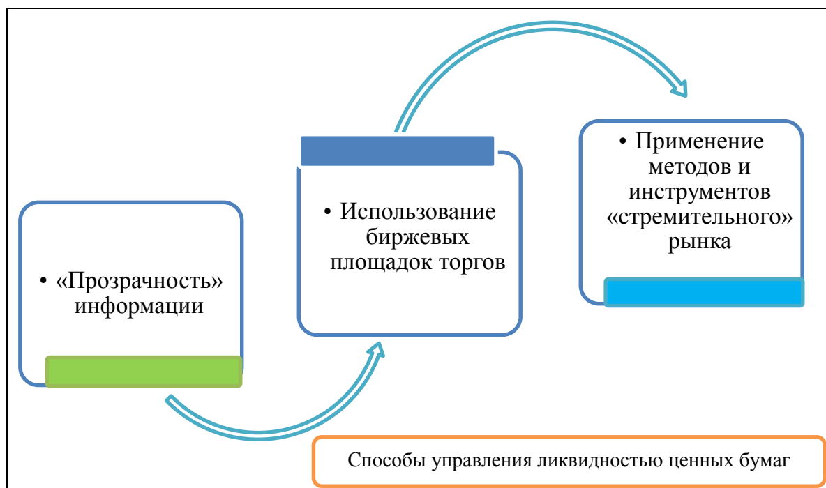
Рисунок 2. Способы управления ликвидностью ценных бумаг

Помимо основных методов оценки ликвидности ценных бумаг, немаловажную позицию занимают способы управления ликвидностью (рисунок 2) [5]: