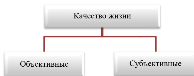
Рисунок 1. Классификация факторов качества жизни [1]

Каждый человек в своей жизни пытается достигнуть определенного благополучия, при котором он мог жить комфортно в материальном, физическом, эмоциональном, а также социальном смысле. В современном мире понятие, которое соединяет все эти аспекты человеческого существования, называется качеством жизни. Данный термин с каждым годом сильнее внедряется в нашу жизнь и начинает играть в ней все более важную роль. Сегодня постоянно проводятся различные социальные и экономические исследования, которые показывают зависимость многих явлений от качества жизни населения. При этом, несмотря на распространенность данного понятия, оно до сих пор остается размытым, поскольку весьма многоаспектно и очень разнообразно классифицируется. Так, например, обратимся к рисунку 1.