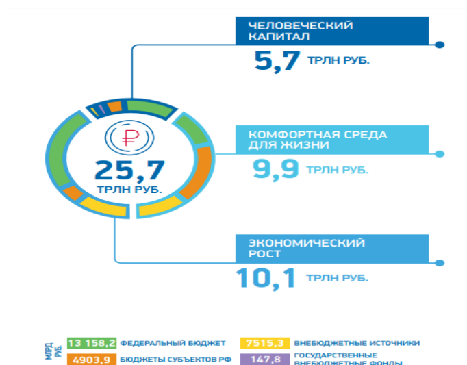
Рисунок 2. Бюджет национальных проектов до 2024 года [3]

В России качество жизни населения повышается и с помощью такого инструмента как национальные проекты. Новые национальные проекты были приняты в 2018 году. 7 мая Президентом был подписан указ «О национальных целях и стратегических задачах развития Российской Федерации на период до 2024 года» [2]. Это подписание было стартом для начала реализации нацпроектов по трем основным направлениям: «Комфортная среда для жизни», «Человеческий капитал», а также «Экономический рост». На рисунке 2 показан бюджет данных программ.