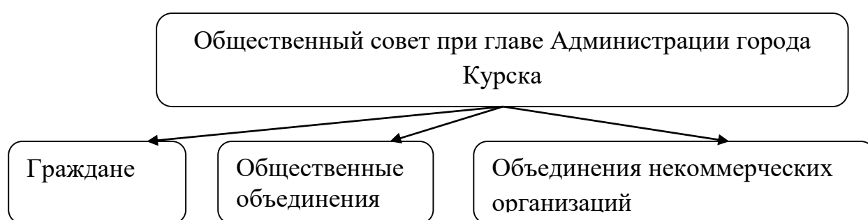
Рисунок 1. Состав Общественного совета при главе Администрации города Курска

Следует отметить, что общественный совет образуется путем добровольного участия следующих участников (рис.1):