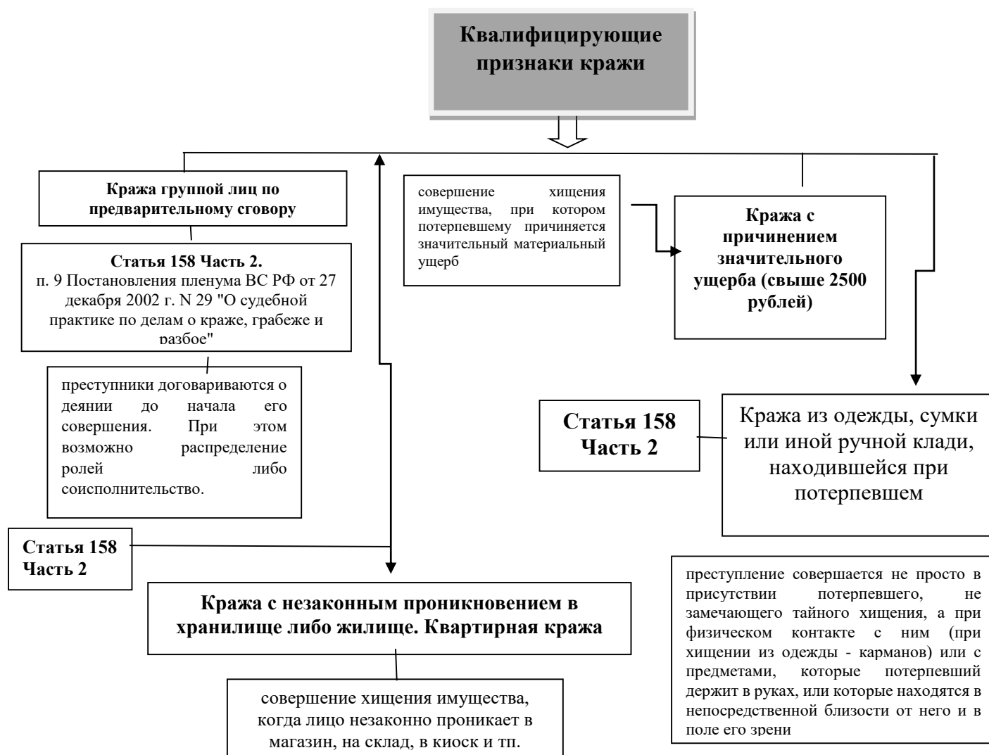
Рис. 1.2. Квалифицирующие признаки кражи

На схеме 1.3. представлены квалифицирующие признаки кражи.