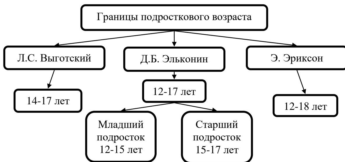
Рис. 1 Границы подросткового возраста

жизненных обстоятельств и накопленного жизненного опыта. На то, какое у человека выработается самоуважение и самооценка влияет не только семья, но и окружающие. Очень важным этапом в формировании личности становится подростковый возраст. Подростком считают ребенка вступившего в период полового созревания. Существует несколько периодизаций возрастных границ. Ориентируясь на основные научные теории (Л.С. Выготский, Д.Б. Эльконин, Э. Эриксон) подростковый период начинается в 12 лет и заканчивается в 18 лет. Весь подростковый период можно разделить на два: дети от 12 до 15 лет – это младший подростковый возраст, с 15 лет до 18 лет – старший.