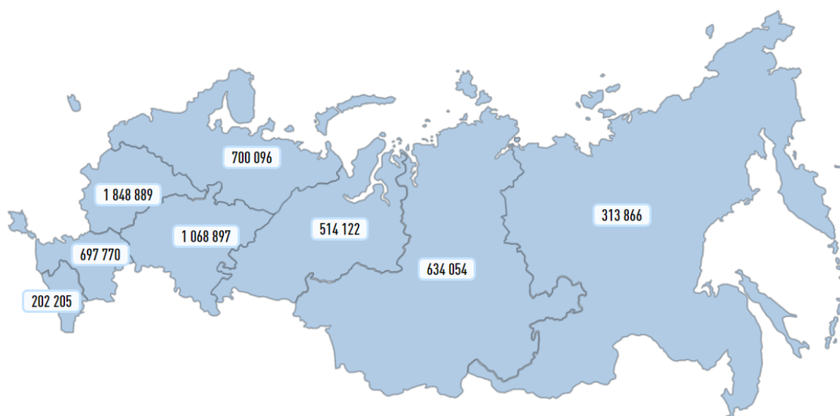
Рисунок 1. - Географическое распределение субъектов малого и среднего предпринимательства по РФ 5 .

На 10 марта 2020 года Единый реестр субъектов малого и среднего предпринимательства Российской Федерации насчитывает 5979899 субъектов, на которых работают 15248464 4 .