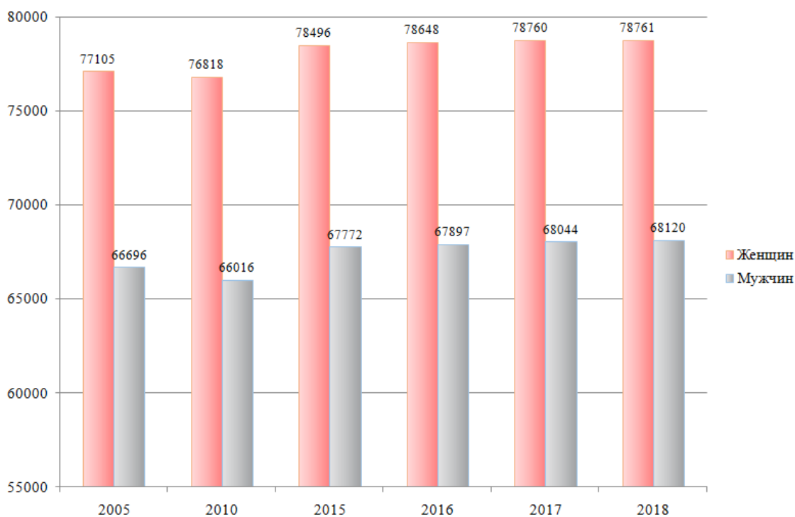
Рисунок 1 – Численность населения в период с 2005 по 2018 год, тыс. чел.

Для анализа роли женщин в трудовых ресурсах страны обратимся к статистическим данным Росстата. На рисунке 1 приведена численность населения по категориям женщины и мужчины на период с 2005 по 2018 гг. [3, с. 23]