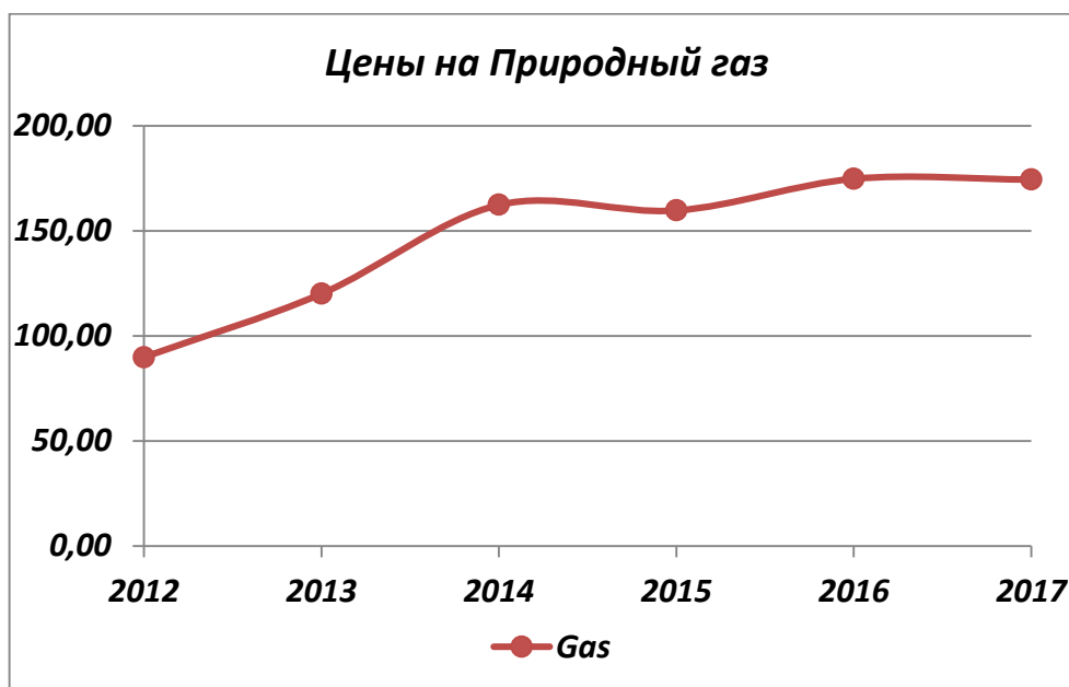
Рисунок 3. Динамика цены на природный газ за последние 6 лет

В динамике цены акций ПАО «НОВАТЭК» и цен на природный газ прослеживаются следующие тенденции: в 2013–2014 годах были проведены некоторые исследования, которые показали, что, если цены на природный газ