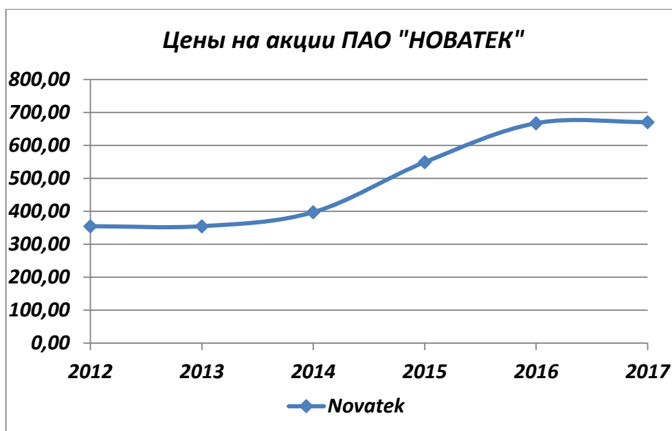
Рисунок 1. Динамика цены на акции ПАО «НОВАТЕК» за последние 6 лет

Средняя цена закрытия за акцию ОАО «НОВАТЭК» в последние 6 лет была на уровне 498,78 рубля за акцию. Наиболее часто встречающаяся цена, которую мы можем наблюдать за данный период - 453,5 рубля за акцию. Стандартное отклонение показывает нам разброс данных относительно среднего значения, другими словами стоимость изменяется в среднем в границах от 354,61 до 670. В данном периоде наименьшая цена оказалась 290,10 рублей за акцию, а наибольшая – 791,90 рублей за акцию. Повышение цены в среднем произошло на 121 рубль за акцию.