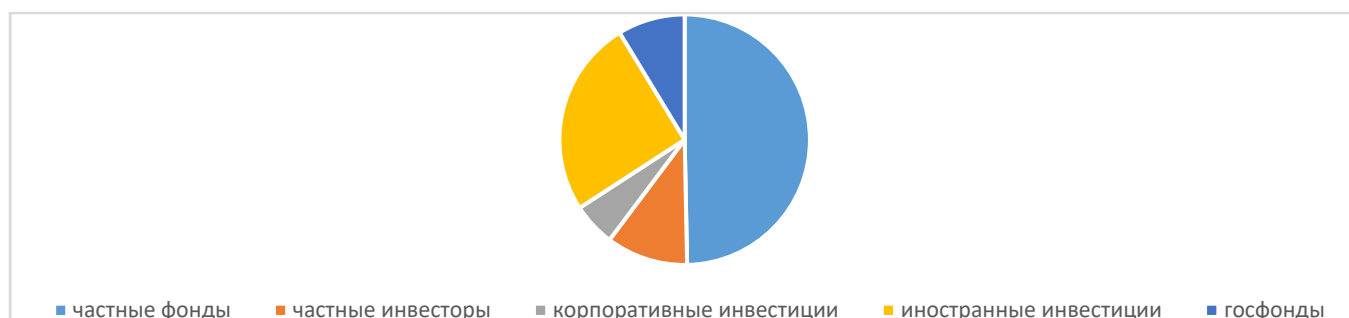
Рисунок 1 – Источники венчурного финансирования

Рассмотрим на рисунке 1 источники венчурных инвестиций России и объемы вложения в рублях.