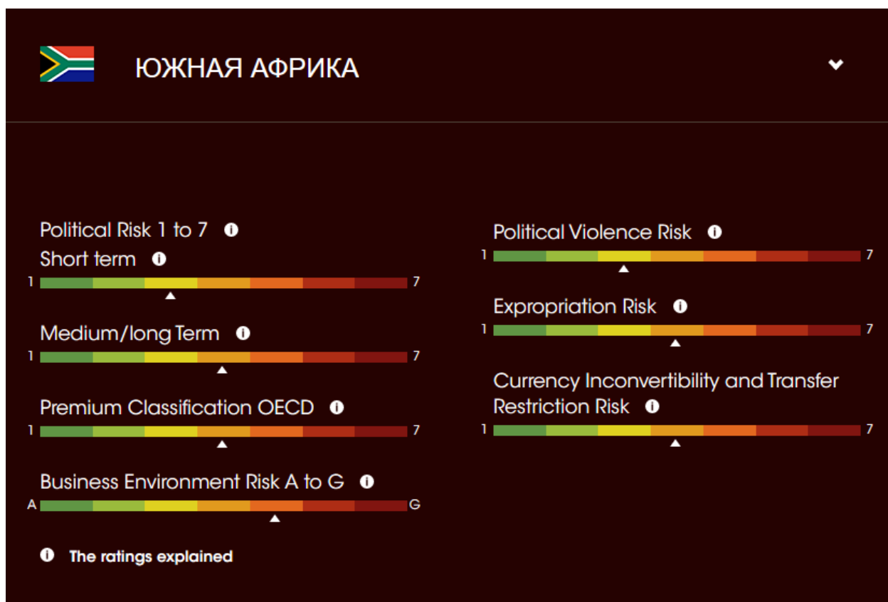
Рисунок 1 – Факторы неопределенности ЮАР

событий в инвестиционной возможности ЮАР, результаты которого определенно будут иметь влияние на оценку странового риска.