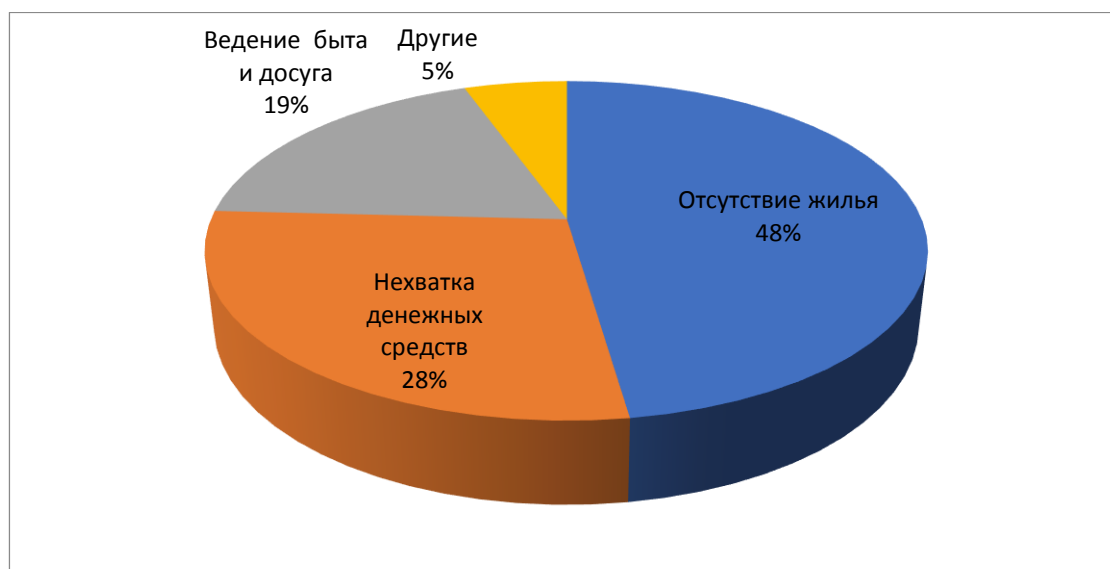
Рис. 1. Ответы респондентов на вопрос «Какие проблемы наиболее актуальные для Вашей семьи ?» (%)».

Остановимся на проблемах, которые беспокоят респондентов, в первую очередь. Разрешалось выбрать пять наиболее актуальных для них (рис. 1).