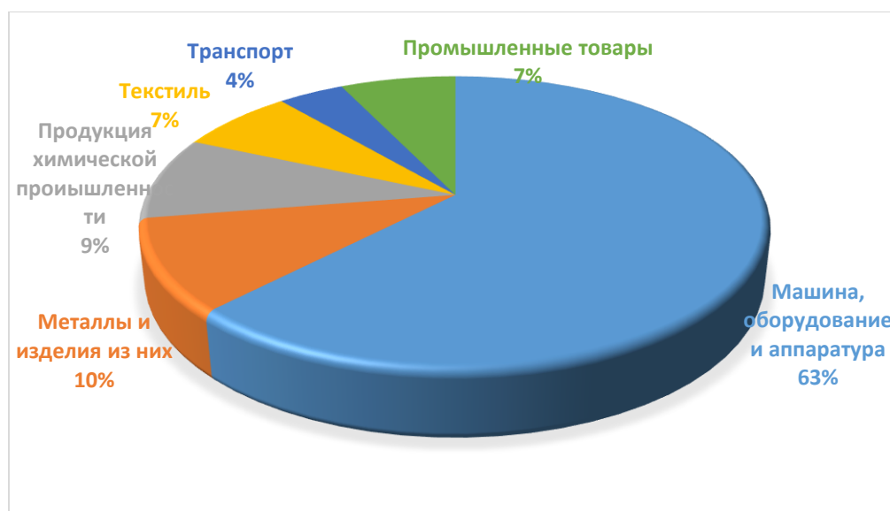
Рисунок 2 – Импорт товаров в РФ из Китая

В основном импортировались машины, оборудование и аппаратура (63%), металлы и изделия из них (10%) и продукция химической промышленности (9%).