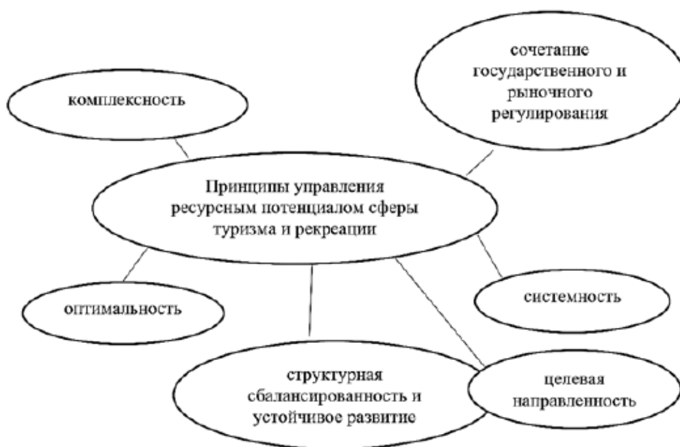
Рис. 1. Принципы управления ресурсным потенциалом сферы туризма и рекреации

Управление ресурсным потенциалом сферы туризма и рекреации в силу специфики объекта базируется не только на общих принципах управления, но и на таких принципах, которые представлены на рисунке 1 [4, с.99]. Данные принципы находятся во взаимосвязи и взаимозависимости, их эффективная реализация осуществляется на основе программно-целевого подхода, предполагающего формулирование долгосрочной стратегии развития в определенном регионе, а на ее основе – общих целей регионального развития с последующим подчинением распределения ресурсов достижению поставленных целей [4, с.100].