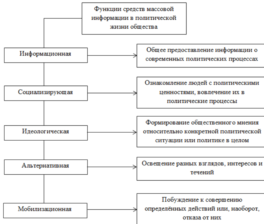
Рисунок 1. Функции СМИ в политической жизни общества

Помимо информирования людей об изменениях, происходящих в политической ситуации отдельной страны или мира в целом, СМИ и коммуникации выполняют ещё несколько функций, полный перечень которых представлен на рисунке [2].