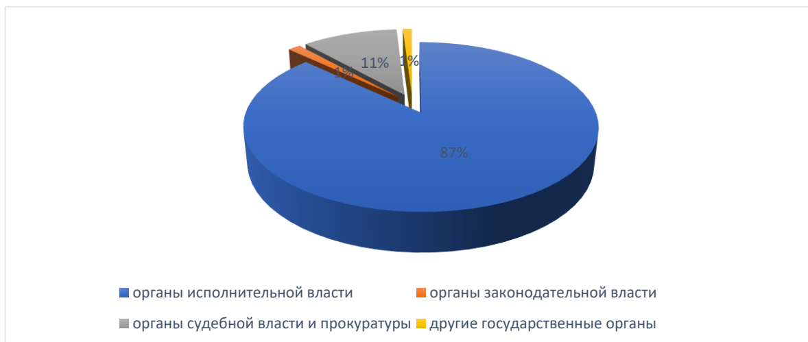
Рисунок 2. Распределение численности работников государственных органов и органов местного самоуправления по ветвям власти на конец 2020 года, %

самостоятельно. Органы местного самоуправления не входят в систему органов государственной власти. В соответствии с Конституцией Российской Федерации местное самоуправление самостоятельно в пределах своих полномочий и структура органов местного самоуправления определяется населением самостоятельно. Рисунок 1.