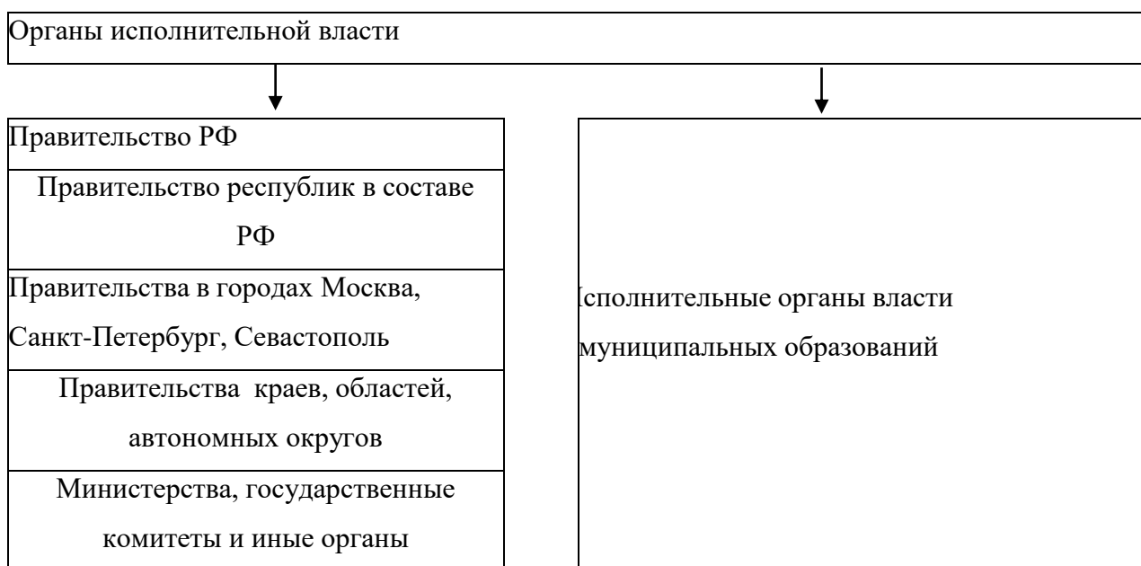
Рисунок 4. Органы исполнительной власти Российской Федерации

Органы исполнительной власти Российской Федерации представлены на рисунке 4.