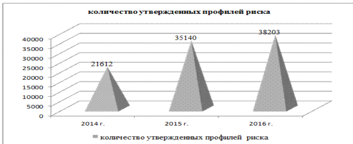
Рисунок 1. Утверждение профилей риска в 2014-2015 гг.

В 2016 году в целях пресечения перемещения товаров и транспортных средств международной перевозки через таможенную границу ЕАЭС с нарушением права ЕАЭС и (или) законодательства Российской Федерации о таможенном деле утверждено и актуализировано 38 203 профиля рисков (Рисунок 1).