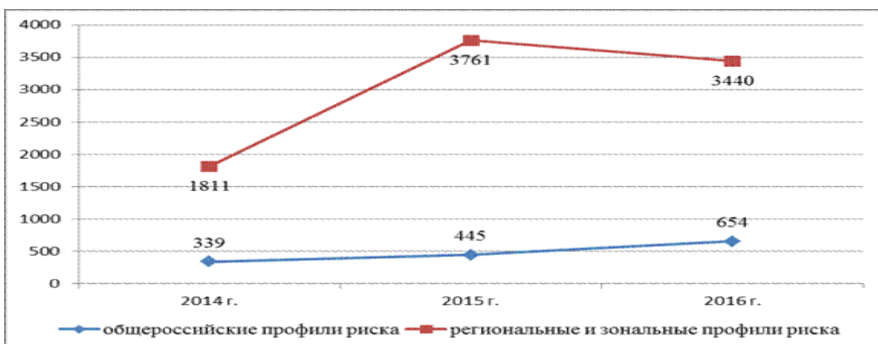
Рисунок 3. Принятие общероссийских, региональных и зональных профилей риска таможенными органами в 2014-2016 гг.

В результате применения профилей риска таможенными органами в 2016 году дополнительно взыскано более 24 млрд. рублей, что на 32% больше по сравнению с 2015 годом (Рисунок 4).