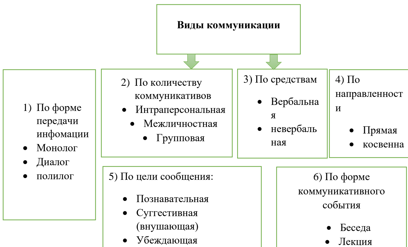
Таблица – 2 – Виды коммуникации

Те виды коммуникационной деятельности, где в качестве активного, целенаправленного субъекта выступает личность, либо группа, либо общество, называются микрокоммуникацией, мидикоммуникацией, макрокоммуникацией. А те виды, где личность, либо группа, либо общество выступают в роли объекта, называются соответственно межличностным, групповым и массовым уровнем коммуникации [5, с. 13]. Диалог возможен только между субъектами одного уровня; управление и подражание — между субъектами всех уровней.