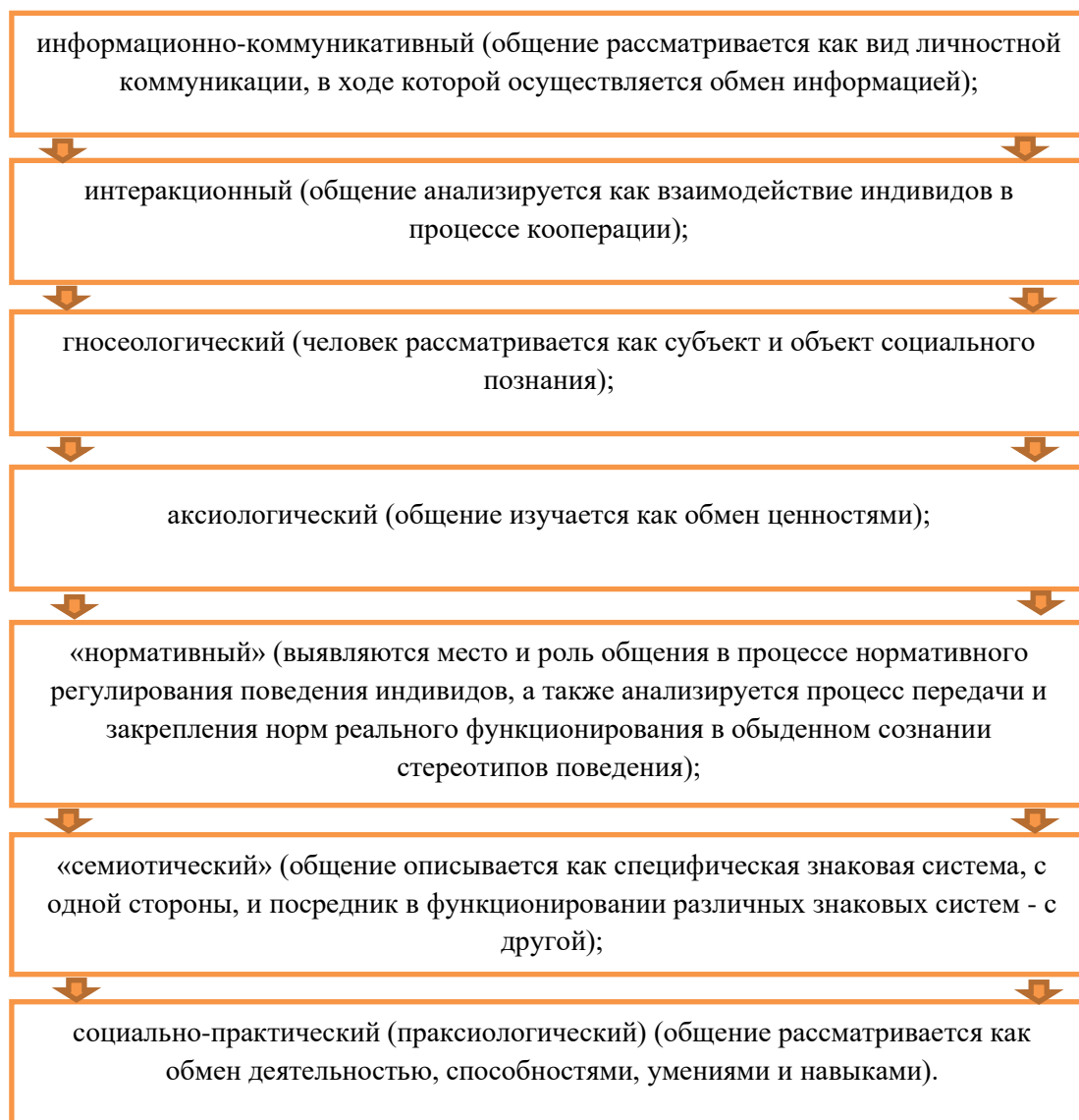
Таблица – 1 – Социально-психологические аспекты

Рассмотрим следующие социально-психологические аспекты на примере таблицы 1.