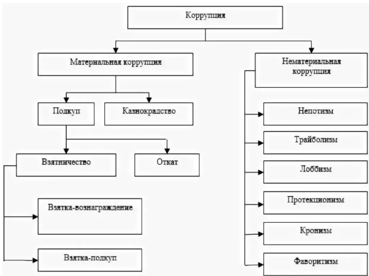
Рис. 2. – Классификация коррупции по предметному признаку

4) типология, основанная на субъективном отношении к феномену коррупции, согласно целям, мотивам, интересам участников, согласно их стратегиям действий: