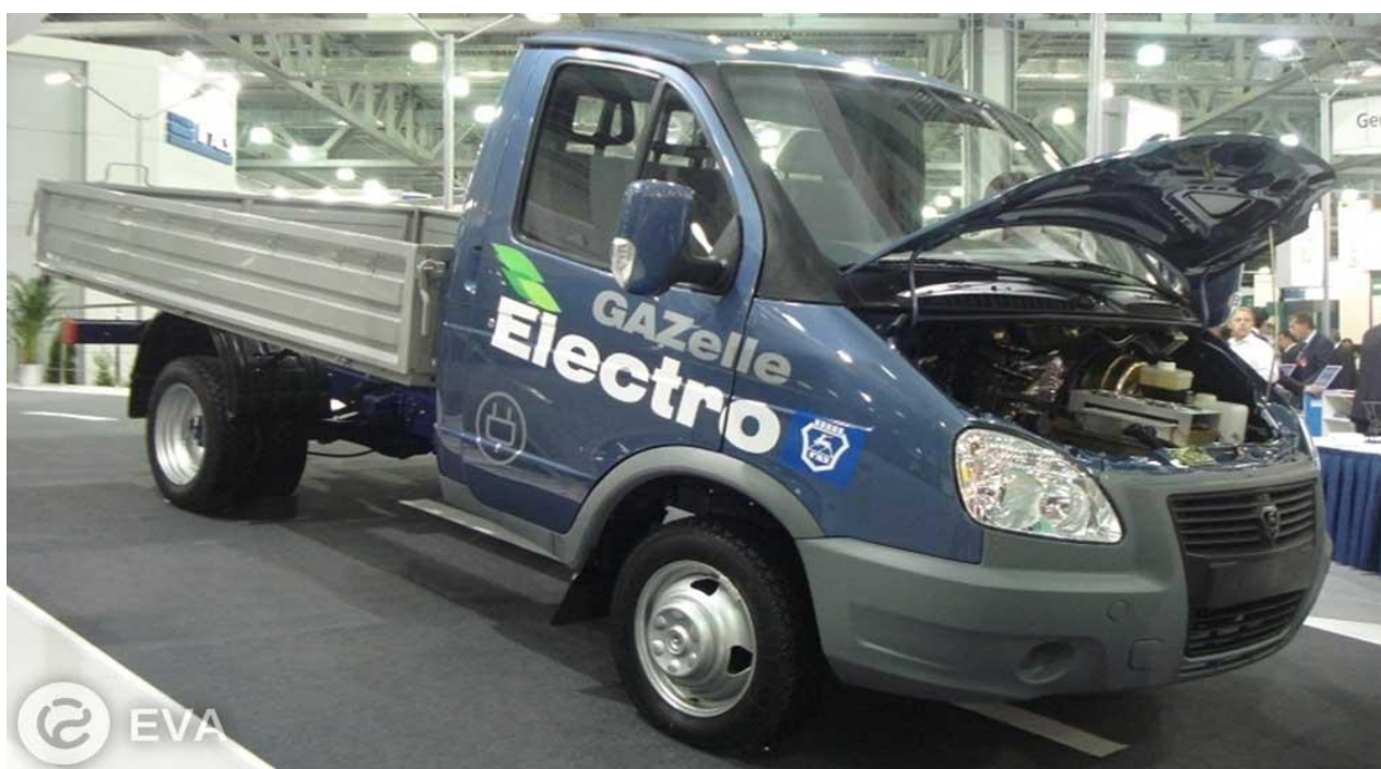
Рисунок 4. Коммерческий электромобиль «Газель»

электрогрузовика, по словам разработчиков, будет составлять около 50 километров; в перспективе эту цифру планируется увеличить. Представители КАМАЗ считают, что отечественные грузовики на электротяге найдут применение в городах и смогут достойно конкурировать с зарубежными аналогами. Горьковский автомобильный завод представил электрический фургон (рис.4). В Газели установлен электрический двигатель Siemens, номинальная мощность которого равна 86 л. с., а максимальная мощность составляет 133 л. с. Аккумуляторные батареи для Газели разрабатывает отечественная компания «СпецАвтоИнжиниринг» — их три вида в зависимости от емкости: минимальная — 23 кВт-ч, средняя – 47 кВт-ч и максимальная – 70,5 кВт-ч. С аккумуляторной батареей 70,5 кВт-ч и электродвигателем фургон сможет разогнаться до 110 километров в час. Разработку Горьковского автомобильного завода уже одобрил Росстандарт. Наличие этого документа позволит продавать электрические Газели во всех странах Таможенного союза.