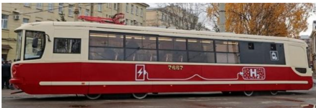
Рисунок 5. Модель трамвая ЛМ–68М

Электрохимические энергоустановки уже устанавливаются на различные типы транспортных средств. Так например, в России разработан прототип первого водородного трамвая. Он должен пройти тестовые испытания на улицах Санкт-Петербурга. На уже существующей модели трамвая ЛМ-68М была установлена электрохимическая энергоустановка на водороде. Общий вид опытного образца трамвая, использующего электрическую энергию, произведенную с помощью топливных элементов представлен на рисунке 5.