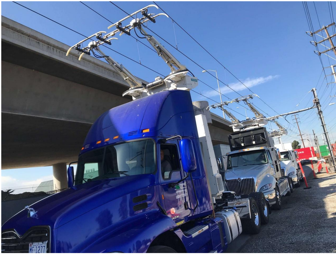
Рисунок 2. Электрифицированная автомобильная дорога

Такая схема работы действительно может сделать крупный междугородный автотранспорт экологичным и дешевым в обслуживании. Остаются вопросы только с стоимостью обустройства таких электродорог. «Принцип троллейбуса» — не единственная разработка по данной теме. Есть и другой проект электротрасс. Здесь энергия будет подаваться по специальным рельсам, от которых электромобиль подпитывается энергией с помощью специальных «подошв». Этот вариант предпочтительнее первого, поскольку им могут пользоваться все участники движения, как электрогрузовики, так и легковые электромобили. Говоря про аккумуляторные батареи, надо отметить, что они остаются самым важным и дорогостоящим узлом всех электромобилей. Финансовое агентство «BloombergNewEnergyFinance» опубликовало отчет о динамике снижения цен на литий-ионные аккумуляторы за семь лет (рис.3). Из этого документа видно, что в 2010 году цена за 1 кВт·ч емкости АКБ составляла примерно 1000 долларов. Потом она начала снижаться примерно на 20 %