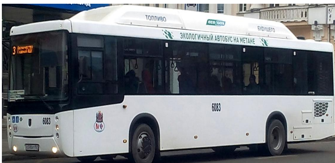
Рисунок 1. Городской автобус, работающий на сжатом природном газе

топливо. Это в первую очередь связано с тем, что имеет место экономическая выгода, связанная с низкой стоимостью газового топлива по сравнению с дизельным топливом. Этот оптимизм разделяют и региональные власти. Они отмечают, что ранее разработанные государственные программы по переводу транспортных средств на газомоторное топливо использовали, как правило, комплексный подход к решению научно-технических задач и коммерческих планов по газомоторной проблеме одновременно на разных видах транспорта: автомобильном, железнодорожном, воздушном и водном. Комплексный подход может реализовать единую техническую политику в данной области на различных видах транспорта, в том числе в части обеспечения безопасности организации снабжения газомоторным топливом и технического обслуживания транспортных средств, с учетом специфических особенностей каждого вида транспорта.