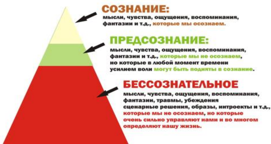
Рис. 1. Устройство психики

Когда при выводе ряда идеологических вопросов естественно смотреть на сознание как на нечто единое и целое, тогда при естественном разборе проблем сознания надо понимать его устройство. Берёт начало с германской философии, сформировалось направление расценивающее проявление духовной деятельности. Это направление получает наибольшее развитие в данный период: известно, что разум по строению состоит из — многих ярусов. Естественно надо учитывать структуру сознания с соответственным материальным началом.